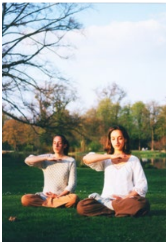
德国法轮功学员寇帕（Koerper）家庭的两姐妹在炼第五套功法

轮功做了数月调查后，得出结论：“法轮功于国于民有百利而无一害。”并向中央政治局提交了调查报告。同年，由医学界专家组成的调查小组，对广东省 12553 名法轮功学员进行表格抽样调查，结果表明修炼法轮功祛病健身总有效率高达 97.9%。