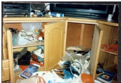
公安非法抄家后的情景

与此同时，全国的“六一零”系统，开始了全国性的搜查法轮功出版物的生产和销售行业。全国查封光盘生产线8条；取缔印刷企业3723家；压缩印刷企业29425家。如湘潭市“六一零”组织搜查了289个书店、街道书摊、音像书店和复印店，禁止出售和没收了超过4万册法轮功书籍和千余份音像制品。