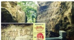
图为“藏字石”照片，小图为风景区门票。

2002 年 6 月，贵州省平塘县掌布乡发现一块巨石，断面惊现六个大字：中國共產党亡。专家组考察证实 巨石有 2.7 亿岁，崩裂于 500 年前，断面的字是天然的化石纹理，没有任何人工雕凿的痕迹。新华网、中央电视台、人民日报等一百多家媒体都有过专题报道，但都隐去了最后一个“亡”字。