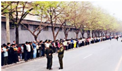
历史图片：1999 年 4 月 25 日，法轮功学员到国务院信访办上访。

然而，“四·二五”当晚，江泽民出于妒忌，把和平上访歪曲成“围攻中南海”，与罗干勾结，于 1999 年 7 月 20 日开始全面迫害法轮功。