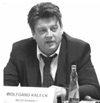
德国律师沃尔夫冈·卡莱克

美国著名人权律师莫顿·斯凯勒教授表示，“江泽民的酷刑和群体灭绝罪，不仅违犯美国法律，违犯基本的国际法，也同样违犯中国政府的法律。因此，诉江案针对的是江泽民个人的犯罪行为。诉江案可以看作是世界人权运动的一部分，这种诉讼的意义在于，在世界范围内建立这样一个基础，即任何官员如果犯下严重侵犯人权的罪行，如酷刑和群体灭绝罪，都要负刑事和民事责任。”◇