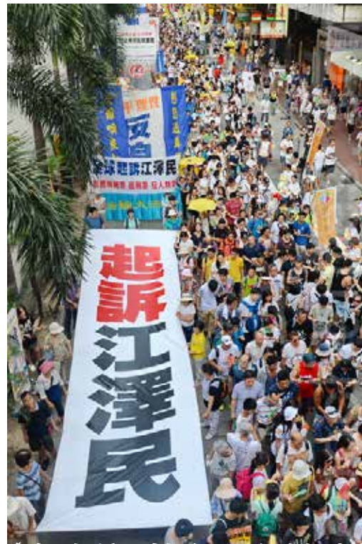
香港7.1大游行,法轮功队伍不惧酷热,打出诉江标语参加游行