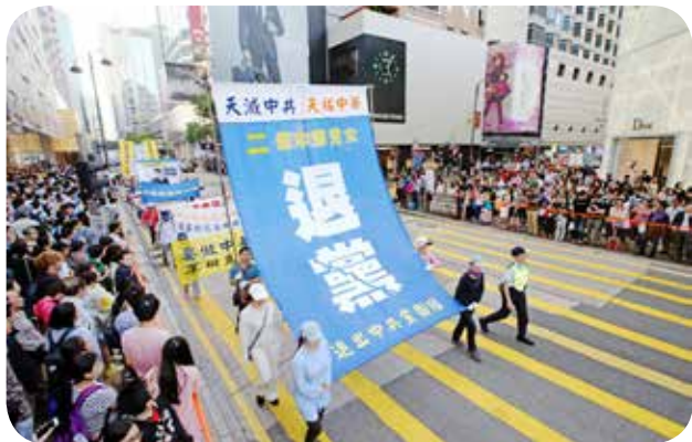
香港法轮功学员声援大陆民众退党大游行

想一想中共建政以来，犯了多少罪恶！中共历次运动中害死了 8000 万中国人，比两次世界大战死亡人数的总和还要多，包括上世纪 50 年代的