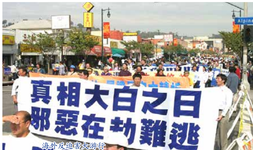
海外反迫害大游行

上述每一个迫害环节，人们都可以看出，恶徒们一直声称是上边让他这样干的；有的干脆直言，就是“610”叫他们干的。进行归纳后，我们会发现这样一个规律：犯人说的上边不过就是警察，而警察或警察的领导所说的上边就是“610”。这个“610办公室”就是中共江泽民一伙迫害法轮功的非法组织，是江泽民等元凶为迫害法轮功而专门设立的一个凌驾于法律和政府之上的特务机构，类似于文革时期的文革小组、希特勒的盖世太保。对法轮功学员迫害的每一个环节无不受到江泽民集团的“610”的操控，在它的操控下，所有的迫害环节就形成了一个完整的犯罪链条。中共江泽民集团对法轮功长达16年的迫害，凭借的就是这样一种邪恶的模式。这个模式表明，迫害完全由江泽民集团的“610”操控，被操纵者只是中共的一个工具而已。江泽民一伙元凶和“610”特务组织的恶徒必将受到法律和天理的惩罚，而被其操纵利用的警察和打手也是罪责难逃。◇