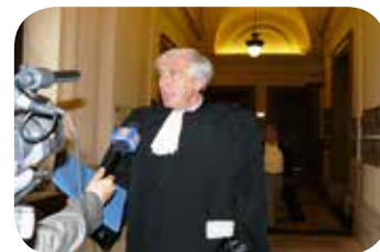
国际人权律师乔治·亨利·波提