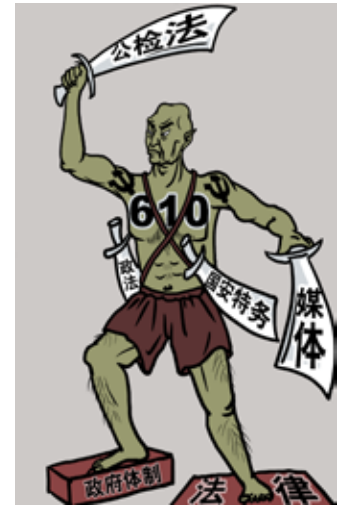
为调集全国所有资源来迫害法轮功，从中央到各省市县都成立了特务机构——“610”办公室。