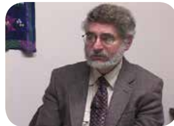
美国律师阿兰·德希维茨