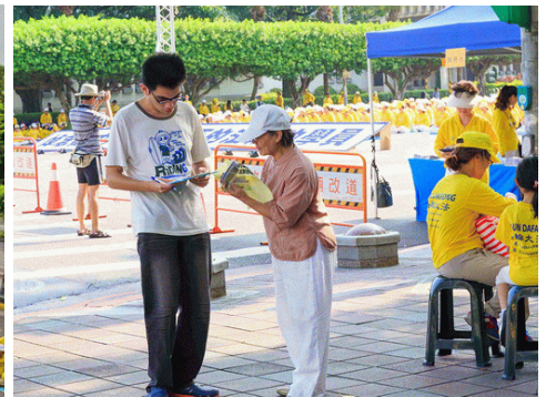
▲ 法轮功学员给过往的民众讲述江泽民迫害法轮功的真相