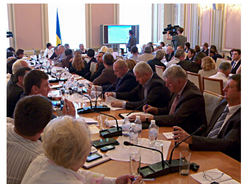
■ 乌克兰最高议会举行器官移植研讨会

麦塔斯在发言中讲到：“成千上万的法轮功学员被（非法）抓捕，并要求他们放弃自己的信仰。如果他们不同意，就会遭到酷刑的折