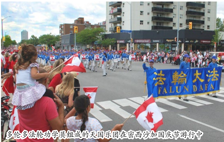
多伦多法轮功学员组成的天国乐团在密西沙加国庆节游行中