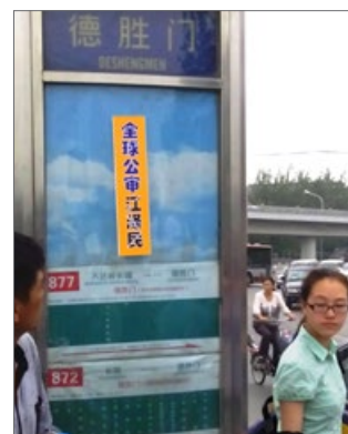
2015年6月下旬，北京街头多处可见审江标语。

卖国土、结帮专权、贪腐淫乱，把中国社会推向丧失道德基准的境地。每个受害者（炎黄子孙、爱国人士、反贪腐的民众）都可以控告。◇