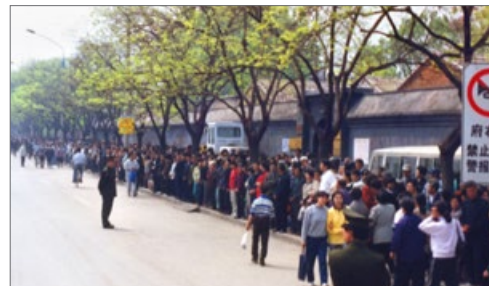
“4·25”上访现场秩序井然

2009 年 7 月 20 日，美中经济权威人士伊森·葛特曼在美国《国家评论》上发表长篇文章，讲述他对发生在中国的“4·25”真相的调查。