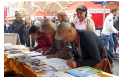
民众签名呼吁停止迫害法轮功

2015年6月21日，德国多特蒙德市慧德 (Hoerde) 地区举办第二届桥梁节，法轮功学员应邀在舞台上展示功法，许多德国民众了解了法轮功的美好和发生在中国的迫害，一些民众排队签名，呼吁制止中共活摘法轮功学员器官。两位市民对法轮功学员说：“我们来自波兰，共产党的坏我们早就知道。”“你们要一直做下去，不要停止。”◇