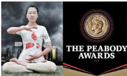
《活摘》荣获皮博迪奖纪录片大奖