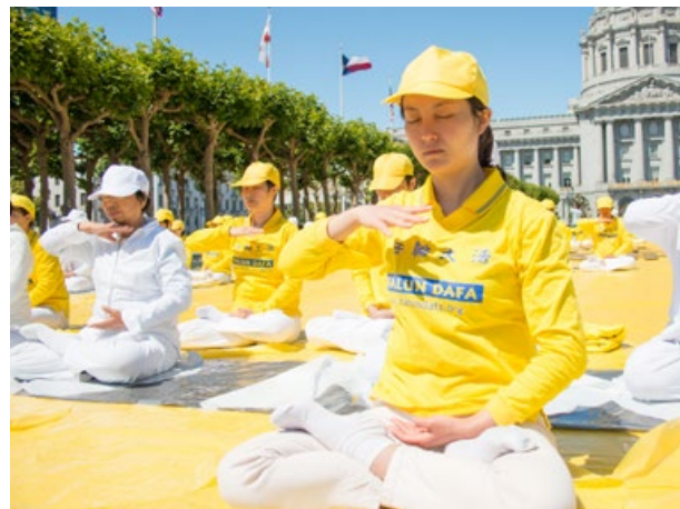
法轮功学员在美国旧金山市政厅广场炼功（2015 年 6 月 6 日）

采访结束后，问玛丽娅能否再说几句话，她的眼圈又红了。这位自由波兰人真诚地说：“我要感谢所有有勇气的中国人，所有有勇气退出中共的人。感谢中国人拥有这样伟大的文化并与世界分享，请珍视她并为之骄傲，因为整个世界都在看着你们，你们在创造历史。”◇