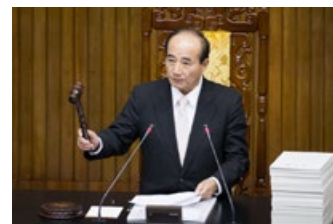
台湾立法院院长王金平

台湾立法院院会于2015年6月12日三读通过《人体器官移植条例》修正案，禁止买卖非法器官，同时规定赴境外移植病患回台进行后续医疗时，须提供器官来源证明。