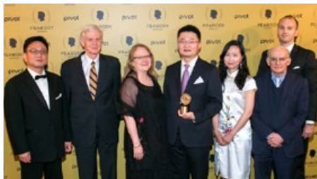
《活摘》团队代表及嘉宾