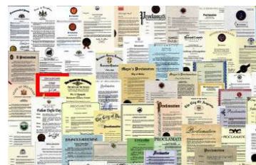
来自国际社会的褒奖（部分）

◎ 弘传世界 法轮大法已弘传到 100 多个国家和地区，受到世界人民的爱戴和尊敬。李洪志先生和法轮大法因对人类身心健康做出的杰出贡献，获各国政府褒奖、支持议案和信函 3000 多项。法轮功书籍被译成 40 种语言，在全球出版发行，并可在互联网上免费下载。◇