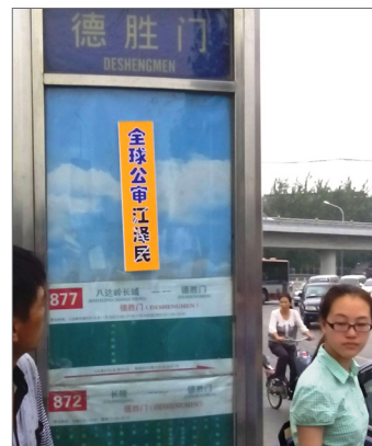
2015 年 6 月下旬，北京街头多处可见审江标语。