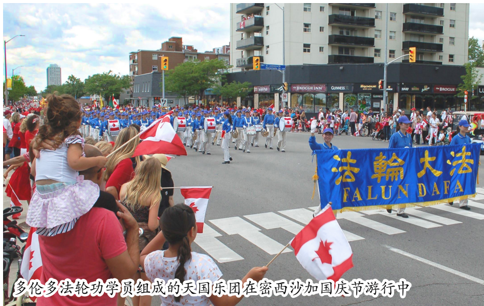
多伦多法轮功学员组成的天国乐团在密西沙加国庆节游行中