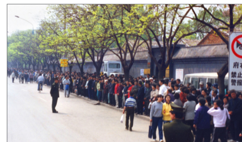
“4·25”上访现场秩序井然

渲染为“围攻中南海”。葛特曼的文章记述了对当事警察和法轮功学员的访谈，再现了“4·25”上访前发生的一系列引发此次上访的导火索。文章最后说：“法轮功没有挑起这场战争。是中共挑起的。”“我们应该更好地了解法轮功的真实历史。”◇