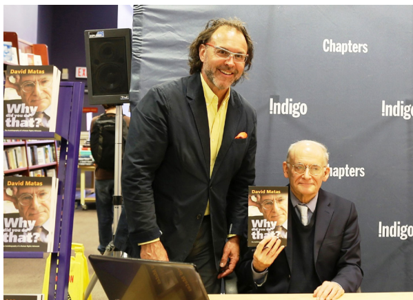
大卫·麦塔斯 (右) 在自传体新书《你为何那样做——人权倡导者的自传》发布会上与读者合影。

“（法轮功）受迫害者采取行动，这是积极的，但这只是一个开始，最终对方必须对申诉人予以回应。”