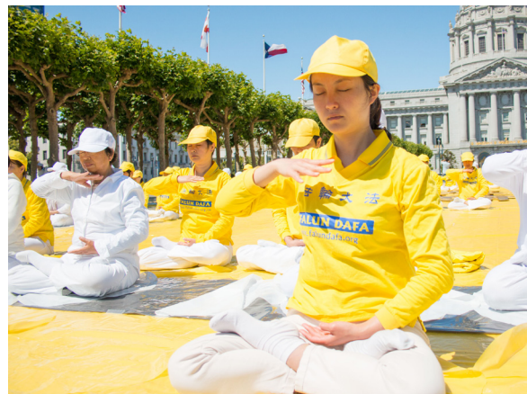
法轮功学员在美国旧金山市政厅广场炼功（2015 年 6 月 6 日）