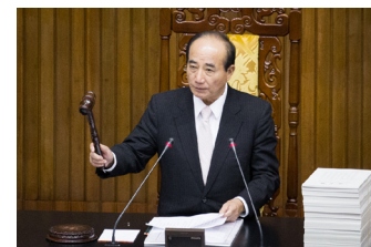
台湾立法院院长王金平

台湾立法院院会于2015年6月12日三读通过《人体器官移植条例》修正案，禁止买卖非法器官，同时规定赴境外移植病患回台进行后续医疗时，须提供器官来源证明。