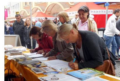
民众签名呼吁停止迫害法轮功

2015年6月21日，德国多特蒙德市慧德 (Hoerde) 地区举办第二届桥梁节，法轮功学员应邀在舞台上展示功法，许多德国民众了解了法轮功的美好和发生在中国的迫害，一些民众排队签名，呼吁制止中共活摘法轮功学员器官。两位市民对法轮功学员说：“我们来自波兰，共产党的坏我们早就知道。”“你们要一直做下去，不要停止。”◇