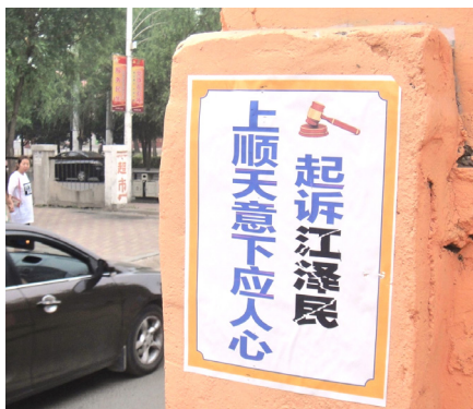
大陆街道的真相标语

故事四：一位法轮功学员告诉他的哥哥，他已经将控告江泽民的控告书邮寄到最高检察院。他哥哥说：“好呀，赶快把这个家伙审判了吧，再不审，这老家伙该死了。”他哥哥还说：“你们人多，又齐心，一定行！到时全国该放鞭炮了。”◇