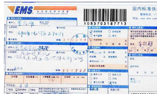
用特快专递邮递诉江状

先是邮政部门人员对法轮功学员的盘查，而后是请示上级、拒收，再就是派人监视并抄学员填写的自己的电话号码。两个月过去了，情况发生了很大变化：目前在各邮局，我们的控江状普遍都能顺利地邮寄出去。