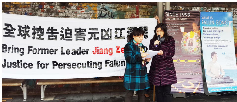
法轮功学员在悉尼奥本市中心的主街上举办诉江活动

要必须联合起来，共同制止这个迫害！因为这事非常、非常地邪恶。这个（罪行）就像当初德国纳粹对待犹太人一样，他是相同的理念和心态，妄想掌控权力，为了个人利益去消灭别人。这是纳粹主义！（迫害）必须停止，必须现在就停止！