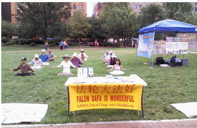
费城法轮功学员在费城自由钟景点集体炼功

2015年8月9日，部分费城法轮功学员在费城自由钟景点集体炼功。正值旅游旺季，许多游客来到这里——美国自由精神的发源地。当天，他们在瞻仰历史遗迹的时候，许多人逐渐将目光转向景点旁讲真相的法轮功学员。当看到其中既有80多岁的老年人，也有8岁的儿童，不少人由好奇变成赞叹，并主动前来学炼法轮功。