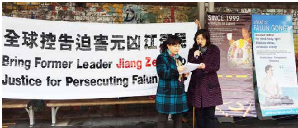
法轮功学员在悉尼奥本市中心的主街上举办诉江活动

要必须联合起来，共同制止这个迫害！因为这事非常、非常地邪恶。这个（罪行）就像当初德国纳粹对待犹太人一样，他是相同的理念和心态，妄想掌控权力，为了个人利益去消灭别人。这是纳粹主义！（迫害）必须停止，必须现在就停止！