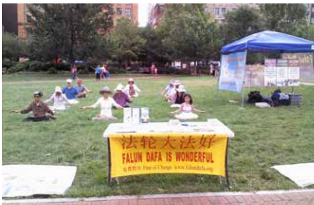
费城法轮功学员在费城自由钟景点集体炼功

2015年8月9日，部分费城法轮功学员在费城自由钟景点集体炼功。正值旅游旺季，许多游客来到这里——美国自由精神的发源地。当天，他们在瞻仰历史遗迹的时候，许多人逐渐将目光转向景点旁讲真