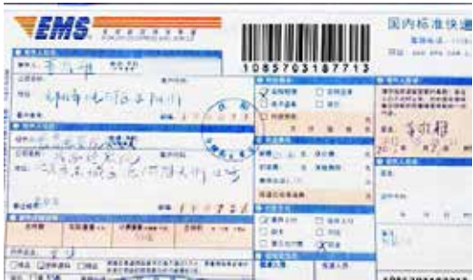
用特快专递邮递诉江状

先是邮政部门人员对法轮功学员的盘查，而后是请示上级、拒收，再就是派人监视并抄学员填写的自己的电话号码。两个月过去了，情况发生了很大变化：目前在各邮局，我们的控江状普遍都能顺利地邮寄出去。