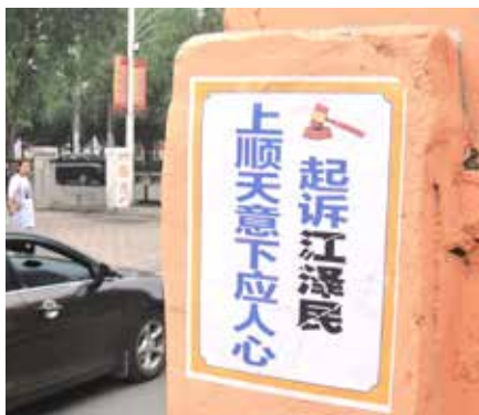
大陆街道的真相标语

故事四：一位法轮功学员告诉他的哥哥，他已经将控告江泽民的控告书邮寄到最高检察院。他哥哥说：“好呀，赶快把这个家伙审判了吧，再不审，这老家伙该死了。”他哥哥还说：“你们人多，又齐心，一定行！到时全国该放鞭炮了。”◇