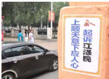
大陆街道的真相标语

故事二：吉林某市一法轮功学员到邮局去投递诉江控告状。邮局的工作人员说：你给我们把控告状念一遍，我们听听。这位学员坦然地大声念起控告状，邮局的人都认真地听着，念完后，所有的人都鼓起掌来，拍手叫好。