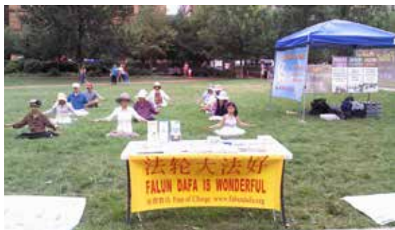
费城法轮功学员在费城自由钟景点集体炼功

2015年8月9日，部分费城法轮功学员在费城自由钟景点集体炼功。正值旅游旺季，许多游客来到这里——美国自由精神的发源地。当天，他们在瞻仰历史遗迹的时候，许多人逐渐将目光转向景点旁讲真相的法轮功学员。当看到其中既有80多岁的老年人，也有8岁的儿童，不少人由好奇变成赞叹，并主动前来学炼法轮功。