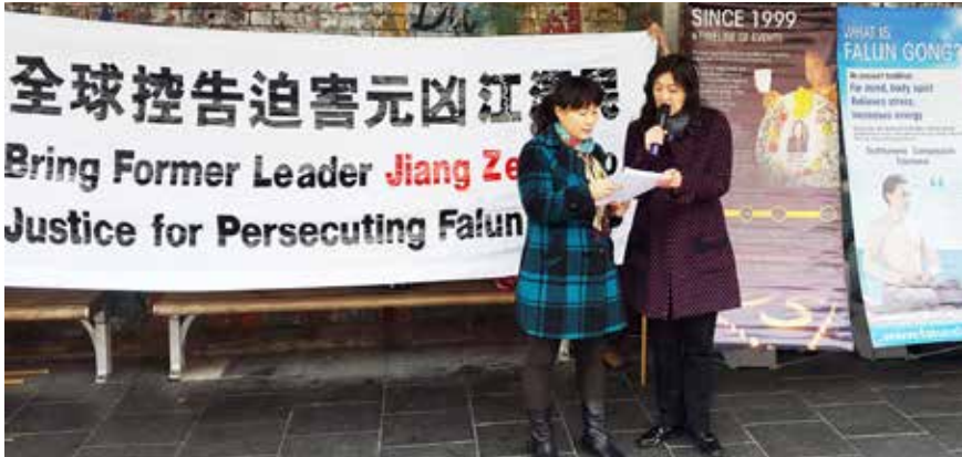
法轮功学员在悉尼奥本市中心的主街上举办诉江活动

现在国安特务走在街上，看到法轮功学员讲真相、劝“三退”，都睁一只眼，闭一只眼，有的国安、“610”头目因害怕遭到清算，还找到法轮功学员说，他们决不会再迫害法轮功