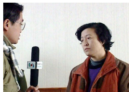
▲ 钻进厕所逃生的女领导