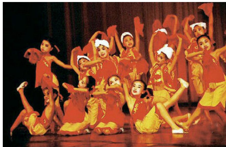
▲ 在舞台上给领导们表演的孩子

中国《宪法》规定：“我国公民有宗教信仰自由的权利。”法輪功赋予我全新的人生观，让我做一个高尚的人，不偷、不抢、不嫖、不赌，何罪之有？制作、散发资料有罪吗？我国《宪法》规定：“公