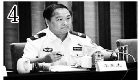
■ 网络图片：追随江泽民迫害法轮功已被清算的四个巨奸大恶 1 周永康；2 徐才厚；3 薄熙来；4 李东生。