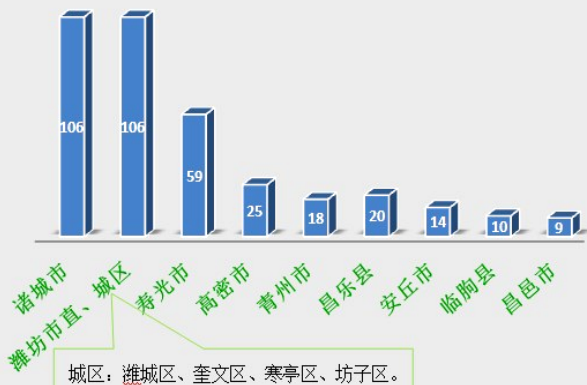
2015 年 潍坊市 367 人被绑架按地区分布