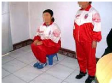
酷刑演示：罚坐小板凳

二零零七年九月十二日，阿城区六一零、政法委、公安局、检察院、法院合谋将我非法判刑三年。二零零