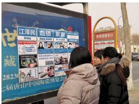
大陆多地出现诉江展板引人注目

法轮功，我可能早进火葬场了。我修炼法轮功仅仅二十六天，奇迹就出现了：多年困扰我的梅尼尔综合症、胃病、风湿性关节炎、腰椎骨质增生、内外痔疮、肛裂，尤其是心脏病等顽疾不翼而飞，病症神奇的消失了。二十一年来，我身体恢复的还像个年轻人，出现了过去说的修道人那种返老还童的状态。这都源于我对大法的坚信，源于师父对我的帮助。”