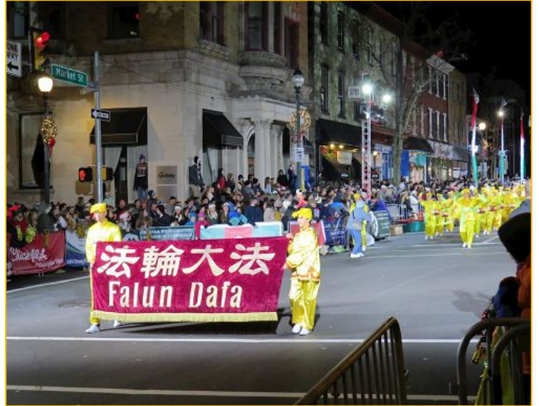
图: 由费城及周边城市的部份法轮功学员组成的腰鼓队应邀参加在西切斯特市圣诞游行, 这已是法轮功学员连续第九年受到邀请。

伍中, 法轮功学员们身着亮丽的黄色中国传统服饰, 击打着具有中国陕西北部民俗特色的腰鼓, 节奏明快、振奋人心, 引起沿途观众的强烈共鸣, 许多人随着鼓点欢呼。当法轮功腰鼓队经过主席台时, 腰鼓队员们矫健、漂亮的动作, 赢得了观众的阵阵掌声与喝彩。主持人热情洋溢地介绍说, “这是一种促进身心健康的打坐方法, 并且通过修炼‘真、善、忍’来提升心灵”。主席台旁的两位年轻女士赞叹不已, 说没有见过这么好的队伍。◇