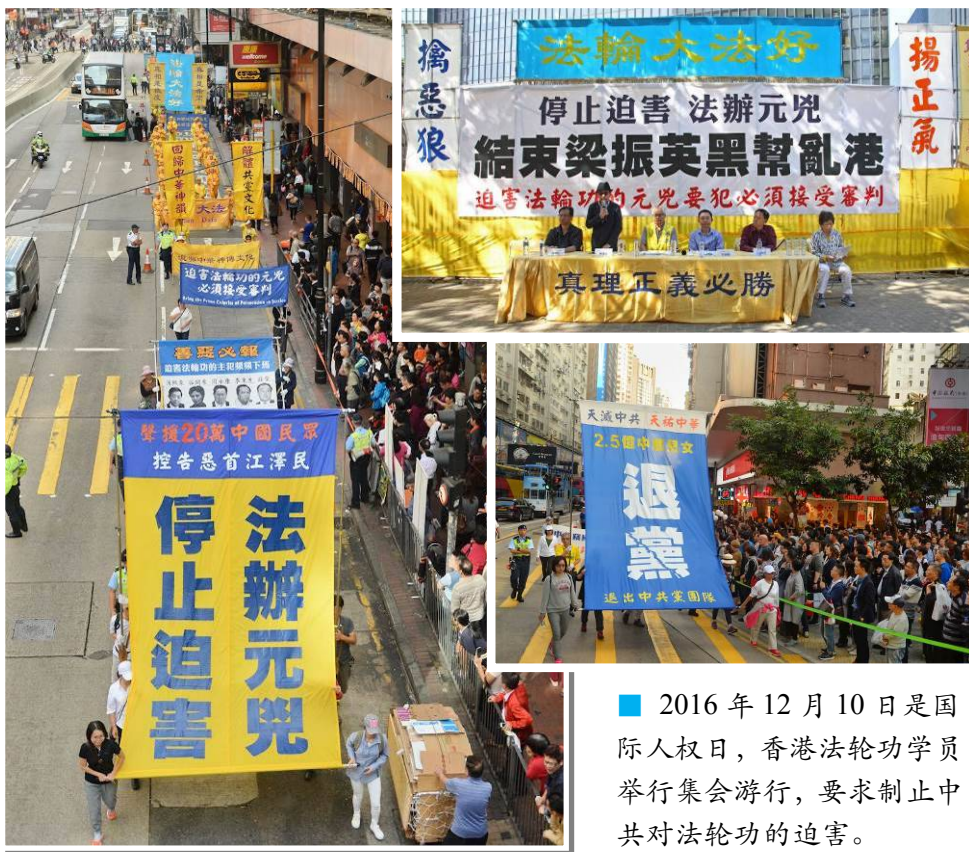
■ 2016 年 12 月 10 日是国际人权日，香港法轮功学员举行集会游行，要求制止中共对法轮功的迫害。