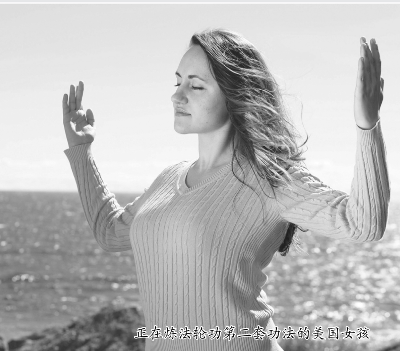
正在炼法轮功第二套功法的美国女孩