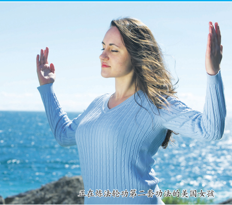
正在炼法轮功第二套功法的美国女孩