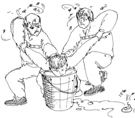
嗅粪桶：二犯人将法轮功学员头强行

【明慧网】自江泽民迫害法轮功以来，上海市提篮桥监狱劫持迫害法轮功学员数以百计，虽严密封锁消息，仍有多起法轮功学员被迫害致死、致疯、致残、致伤消息传出。上海提篮桥监狱一直在非法关押迫害无辜的法轮功学员，对他们进行酷刑折磨，强迫他们违心表态放弃信仰。