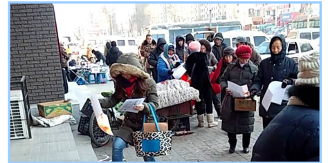
图：近日，长春市法轮功学员在闹市区发放法轮功真相年画等，有百姓高呼：“法轮大法好！法轮大法就是好！”两名警察现场同意“三退”，并在感恩中领了年画和福字。

【大陆来稿】一位法院的警察听我跟他讲法轮功真相后说：“你们法轮功真的了不起，不畏个人安危，只知道为别人好。世人脸没贴字，他是好人还是坏人你也无法识别，可你们就这样没怕心、没私心，真心为别人好，不畏严寒酷暑，讲真相，发资