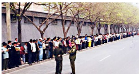
图：1999年4月25日中央信访办前，法轮功学员和平上访，文明安静，警察不用维持秩序，在一旁聊天。所谓的“围攻中南海”根本就不存在。

个好人，做个更好的人，从1992传出后，在短短的七年时间吸引了近一亿人修炼法轮功。而中共恰恰相反，它是不讲真善忍的，它是讲“假恶斗”，在法轮功面前，它的邪恶本质暴露无遗，中共自己不教人做好人，还嫉妒（让）别人做好人，所以才制造借口迫害无辜的法轮功。