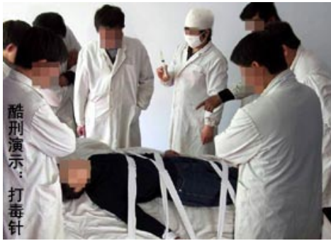
酷刑演示：打毒针（注射不明药物）

然而，一九九九年江泽民发起了对法轮功的疯狂迫害，利用各种宣传工具污蔑、栽赃陷害法轮功，使世人都仇恨敌视法轮功，使所有大法修炼者都受到不同程度的迫害。一九九九年江泽民发起对法轮功疯狂的迫害，在其“名誉上搞臭、肉体上消灭、经济上截断，打死算白死”的指令下，我深受其害，被非法抄家三次、拘留多次，劳教一年，关洗脑班迫害四次，有三次被迫害得生命垂危，其中两次被迫害到有生命危险时，610和派出所才放人，把我放在我大妹家，还有一次是小儿子把我从看守所背回家的。