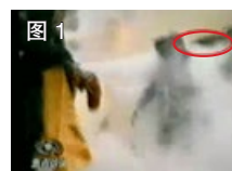
图 1 凶手猛击刘的头部