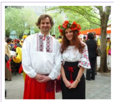
▲ EuggenBfug 和 TotiongStou

5月的纽约，8千多名不同国家、不同族裔的法轮功学员欢聚一起，向李洪志师父表达崇高的敬意，通过各种活动与世人分享自己修炼“真、善、忍”而获得身心升华的体会。