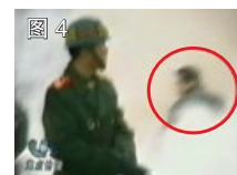
图 4 凶手打过人的姿势

中共称：刘春玲是在自焚中被火烧死的。但央视录像表明：刘春玲是在自焚现场被人用物体重击头部致死，绝非所谓的被火烧死。