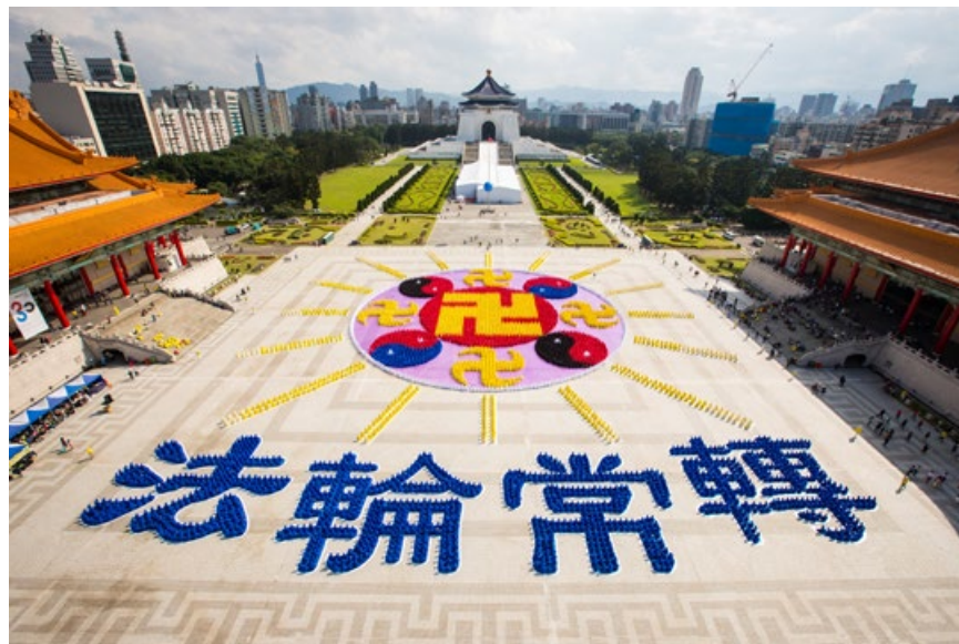
▲ 台湾 6300 多名法轮功学员在自由广场排出“法轮图形”及“法轮常转”四字图像。

从北京来台出差的梁医生及杨医生赞叹排字场面盛大，令人备感舒服。看到这么多法轮功学员不论男女老幼都体现出祥和善良的面貌，穿着整洁朴素，他们心生敬仰之情，很羡慕台湾尊重信仰自由的环境。听到法轮功学员被中共活摘器官，他们非常震惊，杨医生表示：怎会有活摘器官这样离谱的事情发生！