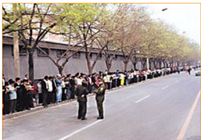
▲ “四·二五”上访现场。秩序井然，警察在悠闲地聊天。

1999年4月25日，万名法轮功学员到北京国务院信访办上访，要求当局给予一个自由合法的炼功环境，这就是著名的“四·二五”大上访。很多人以为，如果没有“四·二五”，就不会有后来对法轮功的迫害，这种看法其实并不能成立。