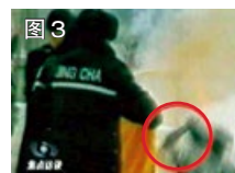
图 3 用手摸头，突然倒地