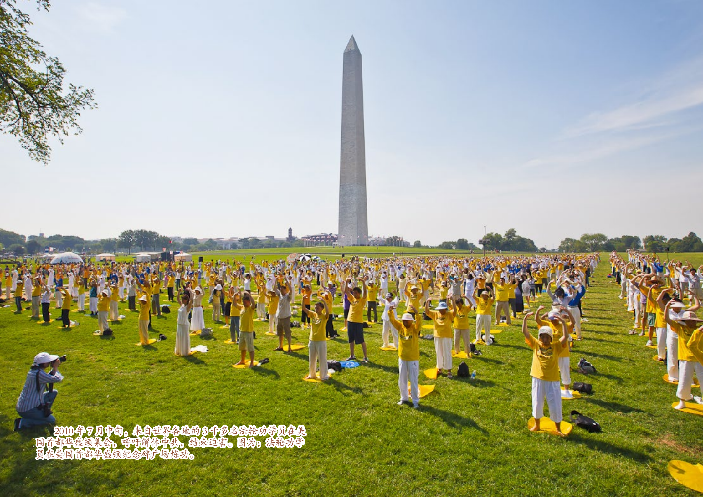
2010年7月中旬，来自世界各地的3千多名法轮功学员在美国首都华盛顿集会，呼吁解体中共，结束迫害。图为：法轮功学员在美国首都华盛顿纪念碑广场炼功。