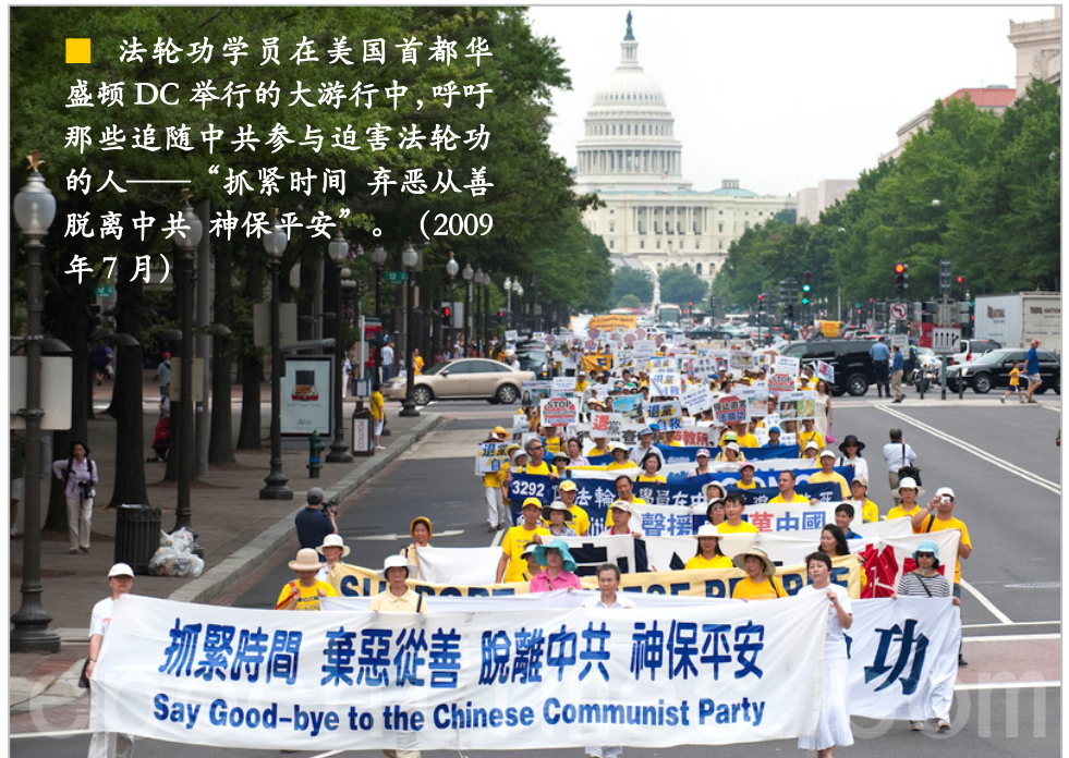
■ 法轮功学员在美国首都华盛顿DC举行的大游行中，呼吁那些追随中共参与迫害法轮功的人——“抓紧时间 弃恶从善 脱离中共 神保平安”。（2009年7月）

中共前党魁江泽民为迫害法轮功，于1999年6月10日专门成了“610办公室”这样一个法外机构。