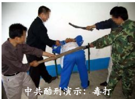
中共酷刑演示：毒打