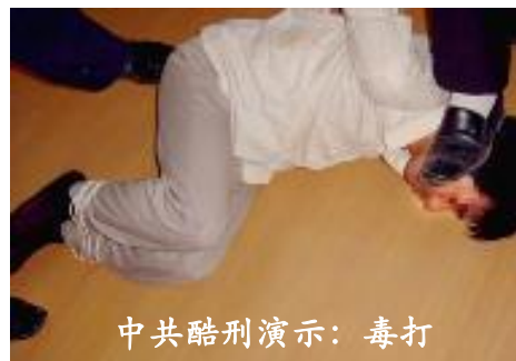
中共酷刑演示：毒打

二零一零年十月十九日及随后几天，在劳教所八大队不法人员为逼迫付老师背叛师父与大法，放弃对“真善忍”的信仰，对他施以酷刑折磨：用穿着皮鞋的脚猛踹头、手猛抽脸、手背击打嘴、用两个手铐将他铐在厕所，不能蹲、不能站，