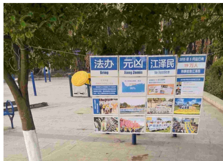
图：大陆各地大量出现“诉江”展板

当沅江地区善良民众得知江泽民利用手中的权力残酷迫害法轮功的事实与操纵军、警、国家各级医院