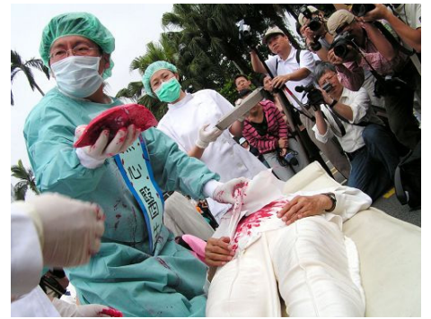
图：法轮功学员在演示中共活摘器官

二零零六年四月三十日，军队医疗系统的证人再次披露中共用军事手段操控活体摘取法轮功学员器官的罪恶。为了暴利，军队、医院、劳教所（监狱、集中营）的警察和医生沆瀣一气、共同勾结，形成了从被关押的法轮功学员活体器官库的建立维持、器官移植市场及中介，到活体器官摘取、移植、实验及利益分赃等环节的完整的“一条龙杀人产业”。