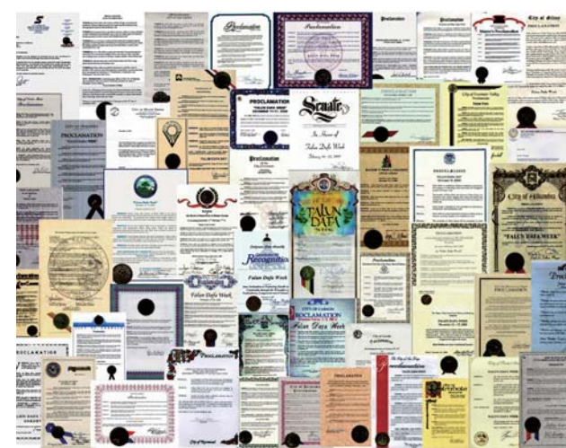
上图 / 法轮功迄今已经收到世界各国政府褒奖 3000 多项 左图 / 一个美国女孩在炼法轮功