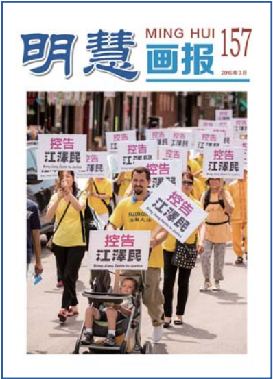
《明慧画报》 第 157 期 (大陆版)

举办游行是法轮功学员展现法轮大法美好、呼吁世人关注迫害的方式之一。画中的老奶奶深夜中正专注地赶制第二天游行要用的法轮图形。法轮横幅垂落下来，散发着柔和的光芒，和桌上的灯光互相辉映。老奶奶透着厚厚的眼镜，对每一针每一线给予同样的专注。