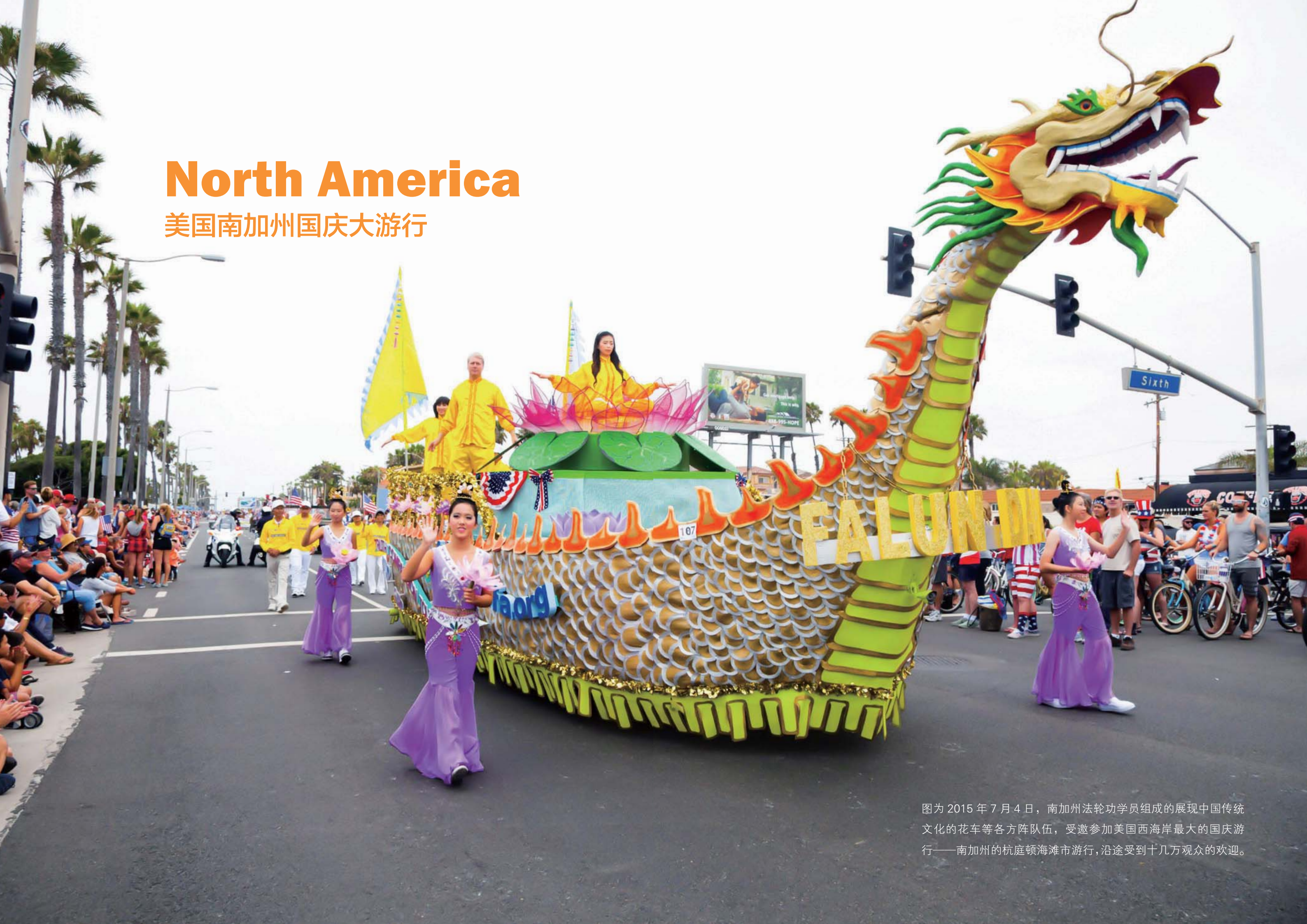
图为 2015 年 7 月 4 日，南加州法轮功学员组成的展现中国传统文化的花车等各方阵队伍，受邀参加美国西海岸最大的国庆游行——南加州的杭庭顿海滩市游行，沿途受到十几万观众的欢迎。