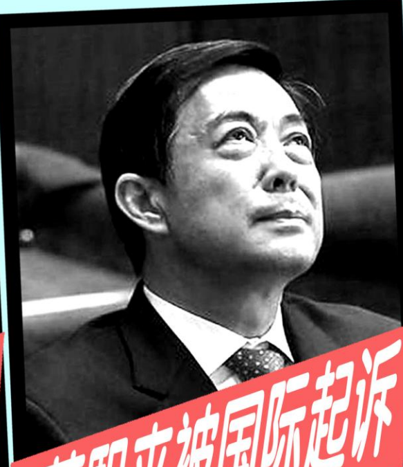
薄熙来被国际起诉