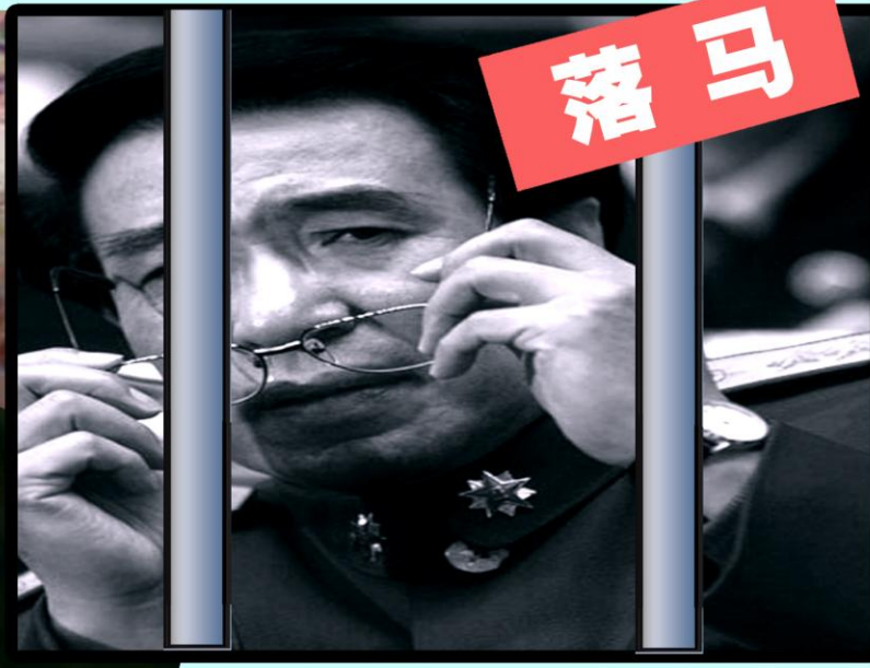
徐才厚,从军委副主席到“国妖”,江泽民迫害法轮功主要帮凶之一,是中共军队系统参与活摘法轮功学员器官的主要责任人,移送最高检察院,癌症死亡