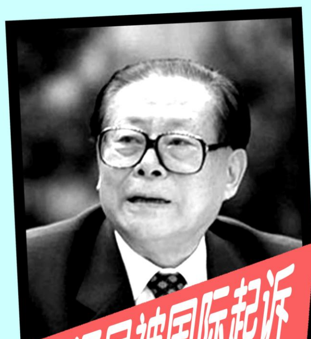
江泽民被国际起诉