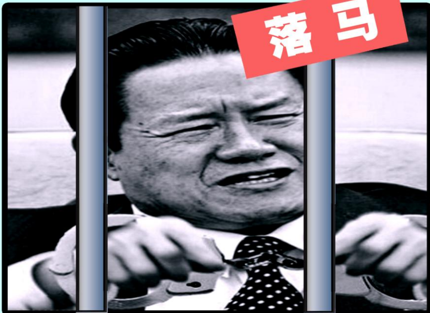
周永康,“政法帮”头子,迫害法轮功的“前台总指挥”,被判处无期徒刑