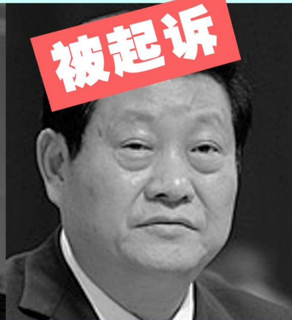
陕西省委书记 赵正永