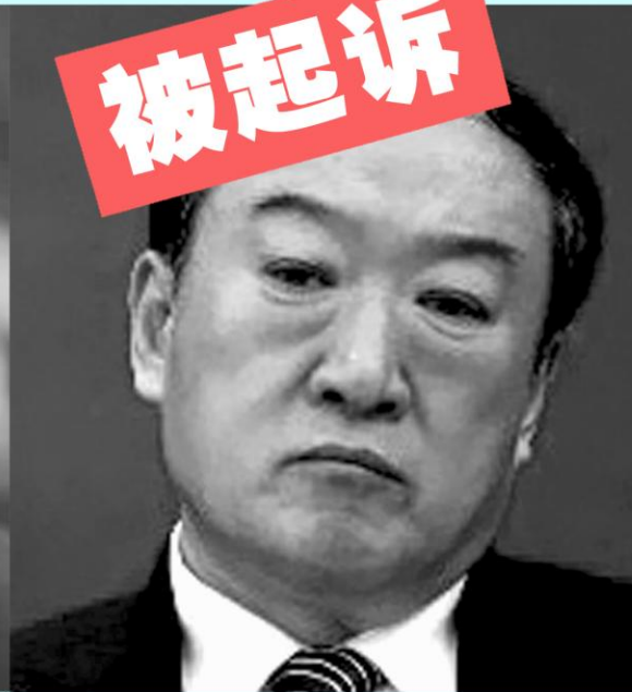
前吉林省委 书记苏荣