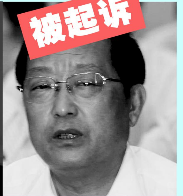
前辽宁省长 陈政高