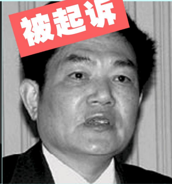
前中科院党组 副书记郭传杰