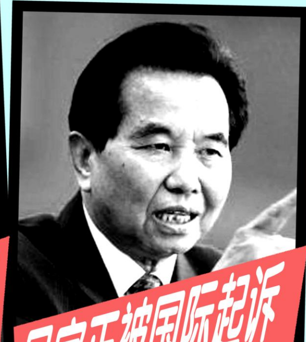
吴官正被国际起诉

2009年11月，西班牙国家法院正式起诉江泽民、贾庆林、薄熙来、罗干、吴官正等迫害法轮功的元凶