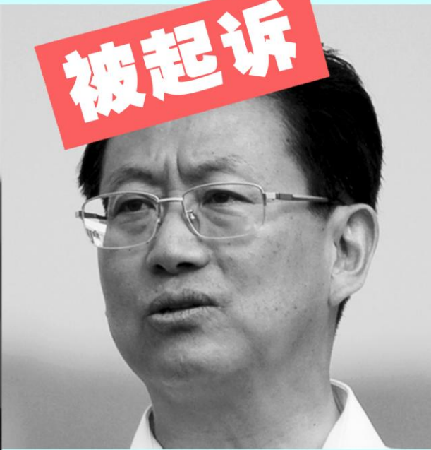
前湖北省委 副书记杨松