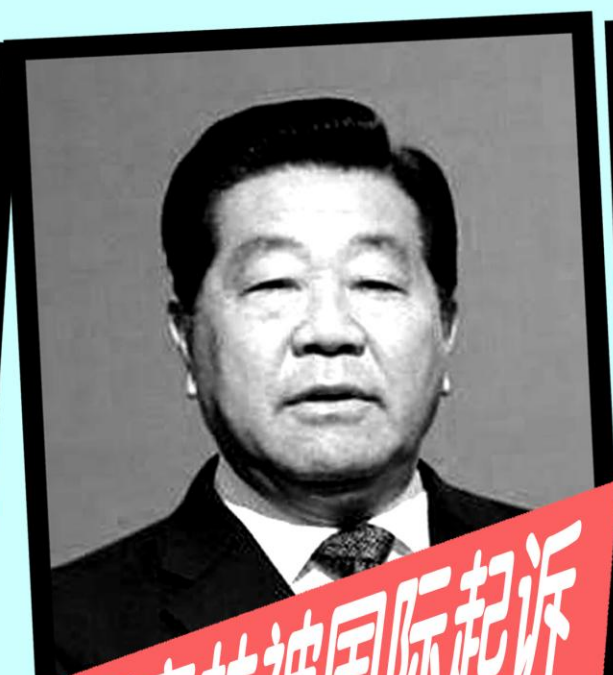
贾庆林被国际起诉