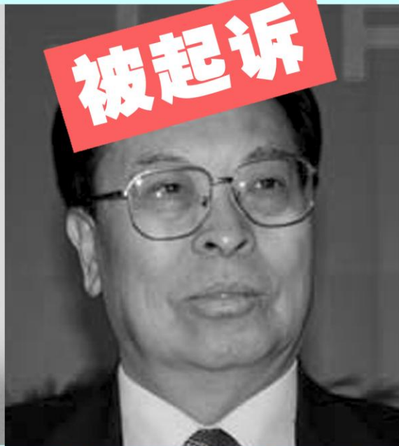
前河南省委 书记徐光春