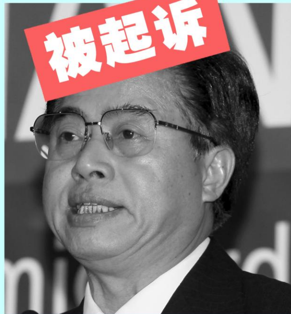
前广东省长 黄华华