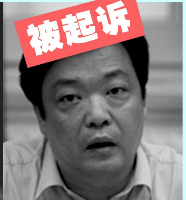
前北京副市长 吉林