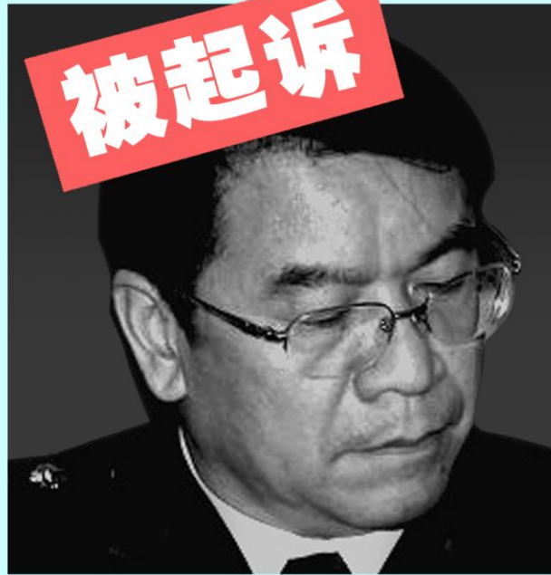
前湖北公安厅 副厅长赵志飞