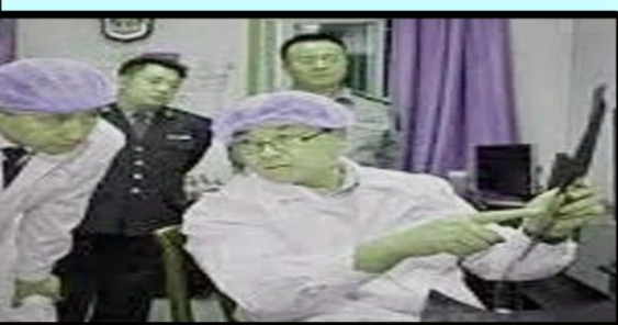
王立军,曾任锦州市公安局长兼任锦州市公安局现场心理研究中心主任