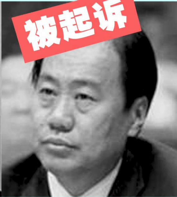
辽宁省政协 主席夏德仁