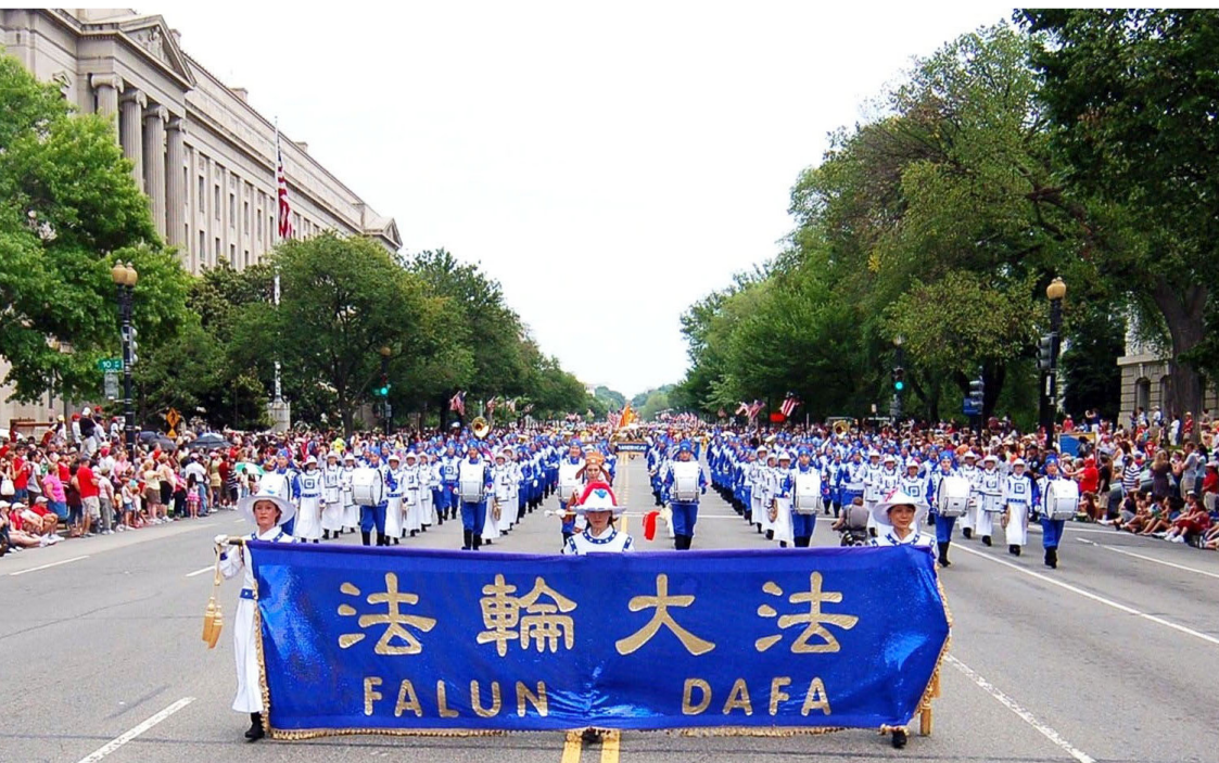
2008年7月4日，法轮功学员参加美国国庆节大游行，沿途观众睹风采