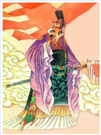
春秋五霸之首齐桓公

【明慧网】子贡问治理国家的办法。孔子说：“粮食充足，军备充足，人民信任。”子贡说：“如果不得不去掉一项，那么这三项应先去掉哪一项？”孔子说：“去掉军备。”子贡说：“如果不得不再去掉一项，那么这两项应去掉哪一项？”孔子说：“去掉粮食。自古人终究是要死的，如果失去人民的信任，那就没有立国之本了。”