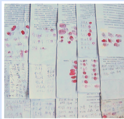
湖南郴州民众部分签名