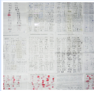
湖南岳阳民众部分签名