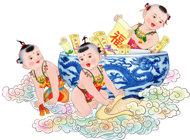
法轮功学员绘画作品：童子送福

2015年开始，老板娘每月给我涨了100元工资，有时发工资再多给一两百元，我说：“不用多给，按原数就行了，你们开店也不容易。”她说：“你跟我们一心一意的，什么都不跟我们计较，我们两口子都说，就是多给你点我们也愿意。现在的社会，上哪儿找你们这样的好人啊？！”◇