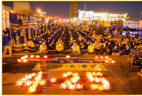
■ 海外法轮功学员纪念“4·25 和平上访”十七周年。（2016 年 4 月）

多年对法轮功的迫害，没有动摇他们坚守“真善忍”的信念。他说：“这么好的功法，却不能让更多的中国人受益，让人痛惜。”