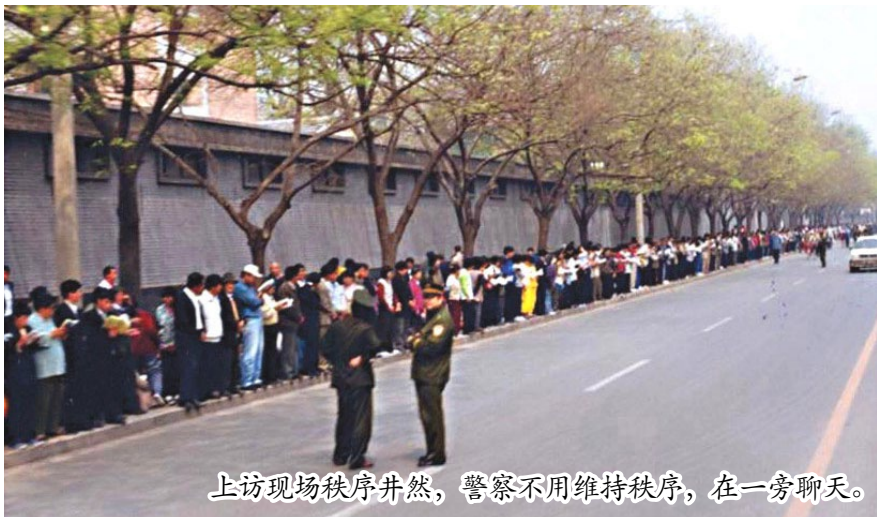
上访现场秩序井然，警察不用维持秩序，在一旁聊天。