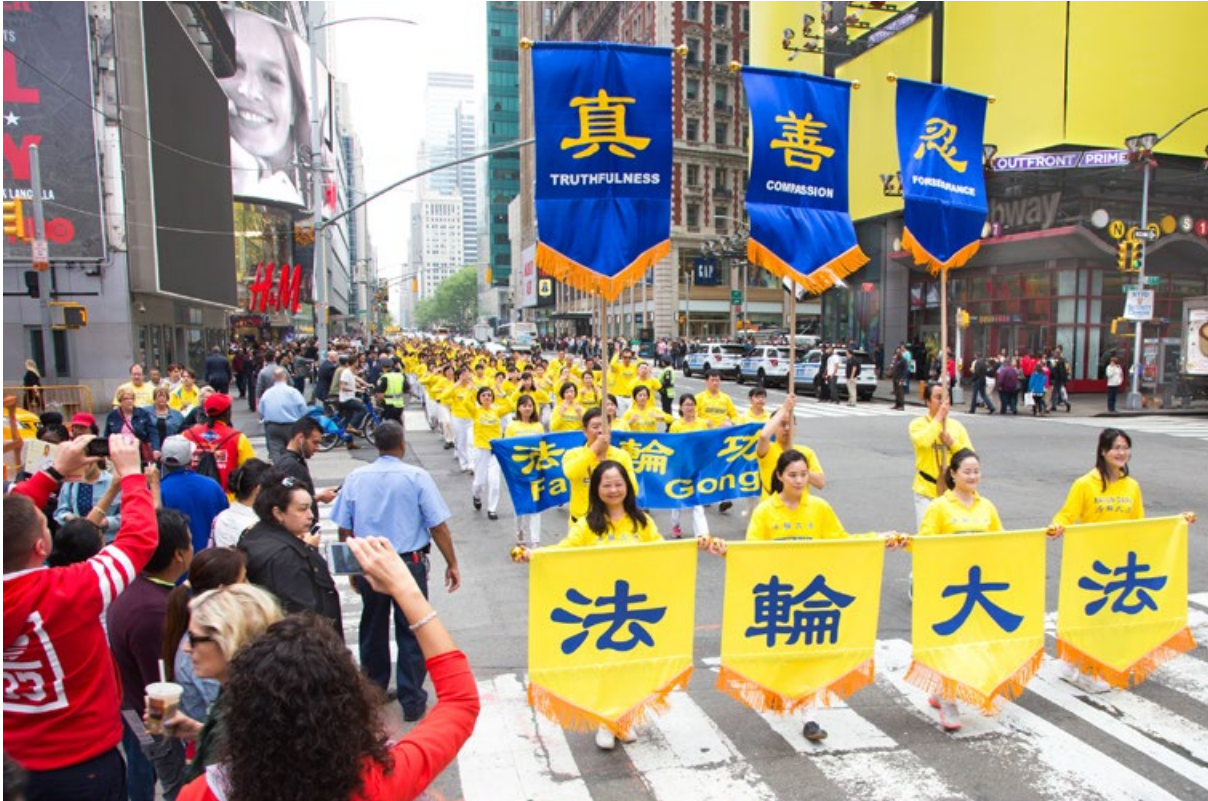
2016年5月13日，近万名法轮功学员在美国纽约市大游行，观众拍照赞叹。

2016年5月13日，是法轮大法弘传世界24周年纪念日，来自53个国家的部分法轮功学员近万人，汇聚美国纽约市，在曼哈顿举行盛大的游行。游行由三大方阵组成：“法轮大法好”、“停止迫害法轮功”和“声援两亿三千万中华儿女退出中共”。数十万人观看了游行。