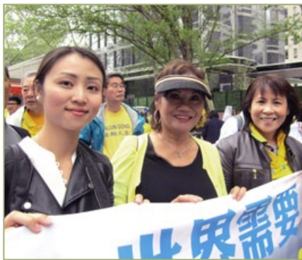
越南裔医生阮女士（右一）