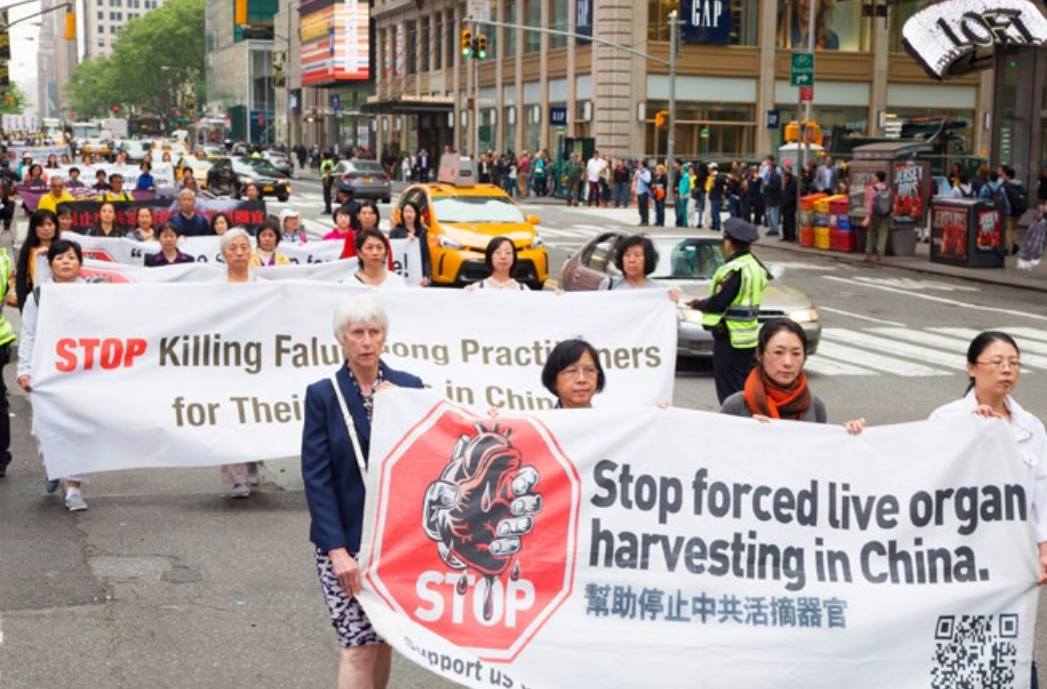
游行中的横幅：制止中共活体摘取大陆法轮功学员的人体器官