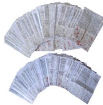
河北 3495 人联名举报江泽民

据明慧网报道统计，自 2015 年 5 月至今，在中国大陆已有超过 21 万百姓联名举报迫害法轮功的元凶江泽民。这些联名来自北京、天津、河北、山东、辽宁、吉林、黑龙江、湖北、湖南、江西、福建、广东、贵州、四川等地。山东招远市民在举报信中说：“江泽民没有人性，以权代法，祸国殃民。我们都被他骗了，所以要举报他。”“望最高检察院将其绳之以法，为民除害。真正做到依法治国，才能国泰民安。”◇