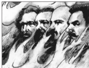
共产党的鼻祖马恩列斯

全球数千共产主义雕像被推倒炸毁。来自西方的共产主义和共产党，作为一种邪说和邪恶组织祸乱人间一百多年，遭全球唾弃。目前全球只剩四个共产党国家：古巴、越南、朝鲜、中国。