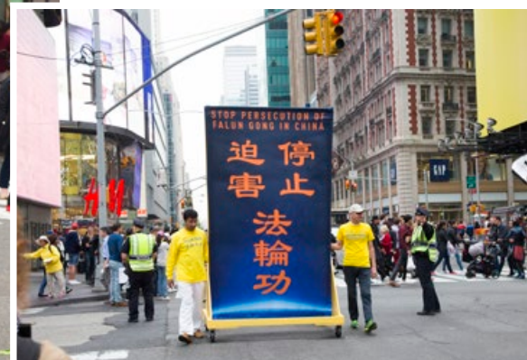
在全世界，只有中共政权在迫害法轮功。 图为游行的第二方阵：停止迫害法轮功。