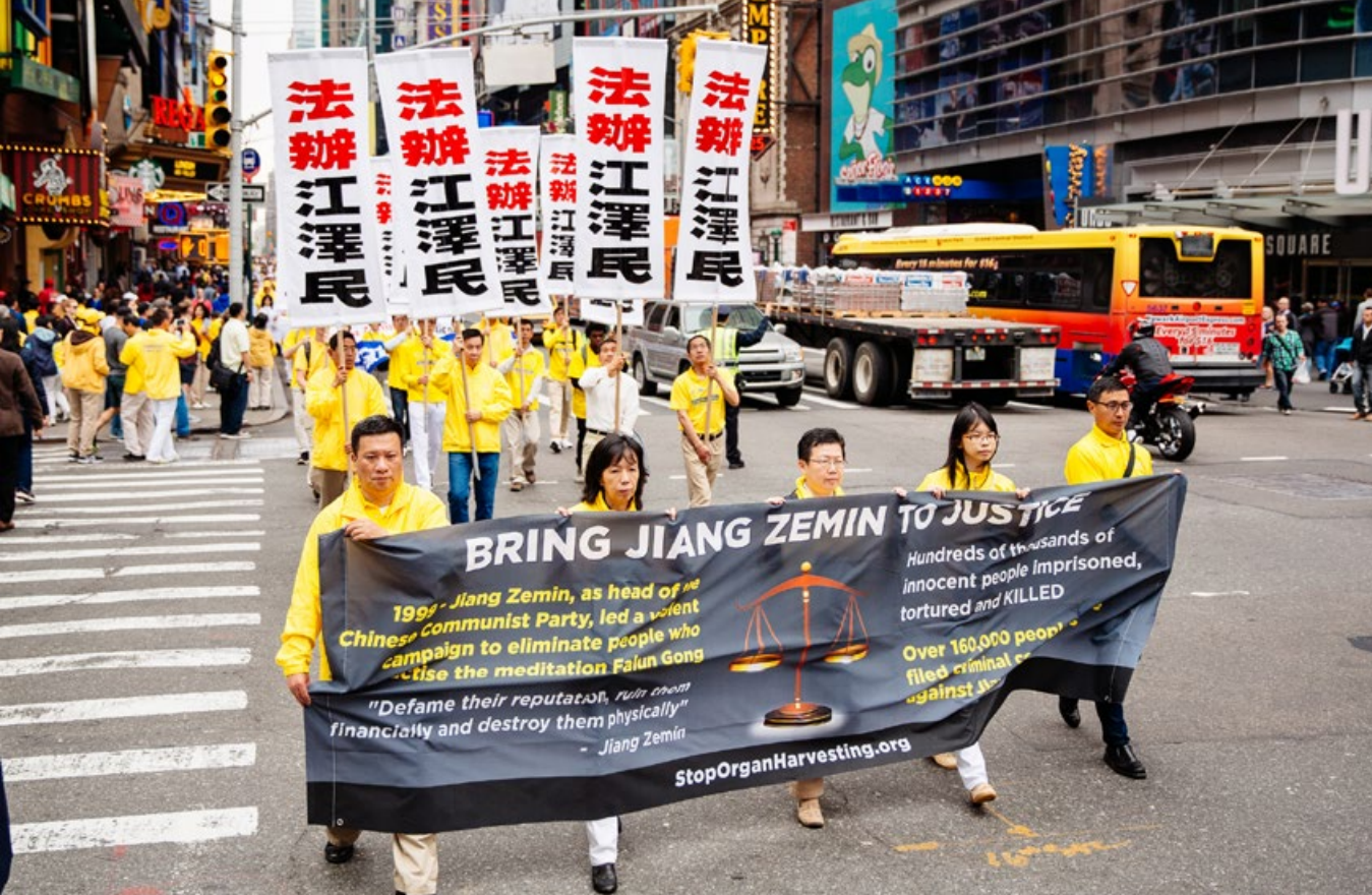
大游行中呼吁法办江泽民