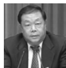
原天津市政法委书记、公安局长宋平顺，自杀身亡。

◆武长顺：时任天津公安局副局长，2014年被立案调查，2015年被移送司法处理。◇