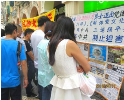
一批又一批的大陆游客在澳门景点仔细阅读法轮功真相

2016年4月17日, 澳门法轮功学员在玫瑰堂前举行讲真相活动, 一位女士走过来, 表示要参加法轮功学员的活动。法轮功学员问她: “你入过中共的党、团、少先队吗? 你知道三退(在海外网站发表声明退党、退团、退队)保平安吗?” 对方表示不知道, 法轮功学员向她介绍: “中共前头目江泽民因为妒嫉法轮功修炼人数多, 于是发起了迫害运动, 中共甚至做出活体摘取法轮功学员器官的恶事, 天理不容。天灭中共是天意, 上天就看我们的选择。不与邪党捆绑在一起, 选择良知, 就是顺应天意, 就有好的未来。你走到哪里, 都会得到上天的佑护。希望你声明退出邪党组织,