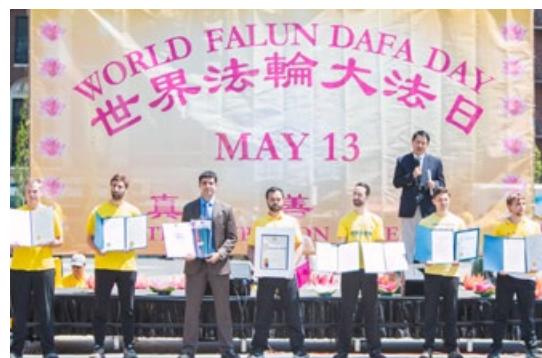
美国政要对法轮大法颁发的部分褒奖状