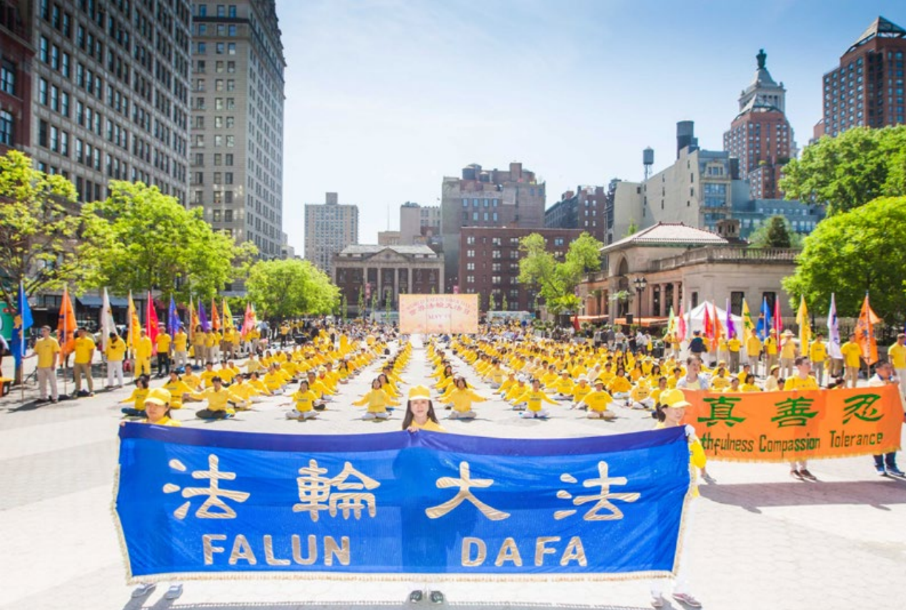
2016年5月12日，上千名法轮功学员在美国纽约联合广场庆祝法轮大法日。