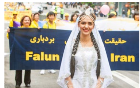
身穿民族盛装的各族裔法轮功学员

年的这个时候我就会（从中国）出来旅游二十来天，就为了看这个游行。多壮观啊，多美好啊。”他说：“现在中国最危险的就是人没有道德底线了，道德败坏是一个国家的悲哀啊。我看到只有法轮功能给中国带来希望，让人们道德回升。法轮功是中国的希望。”◇