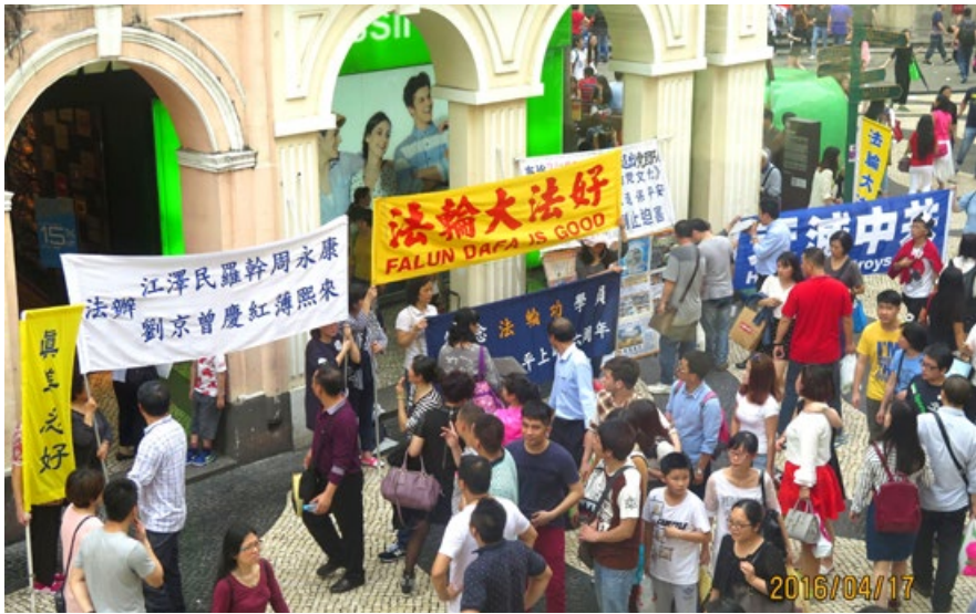
澳门玫瑰堂前, 大陆游客驻足了解法轮功真相。