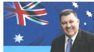
澳大利亚联邦议员克雷格·凯利

15年前，我去中国商务旅行。在深圳一家宾馆的前厅，陈列着各种旅游小册子，其中摆着中共印制的诋毁法轮功的宣传册，我边看边想：为什么要用如此不公正的宣传来反对法轮功？现在，我已经找到了答案：法轮大法倡导的是“真、善、忍”，这一原则与共产党的理念（假、恶、斗）截然相反。