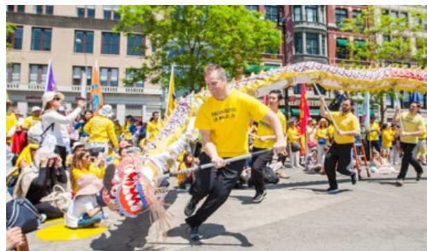
喜庆的舞龙受到观众欢迎