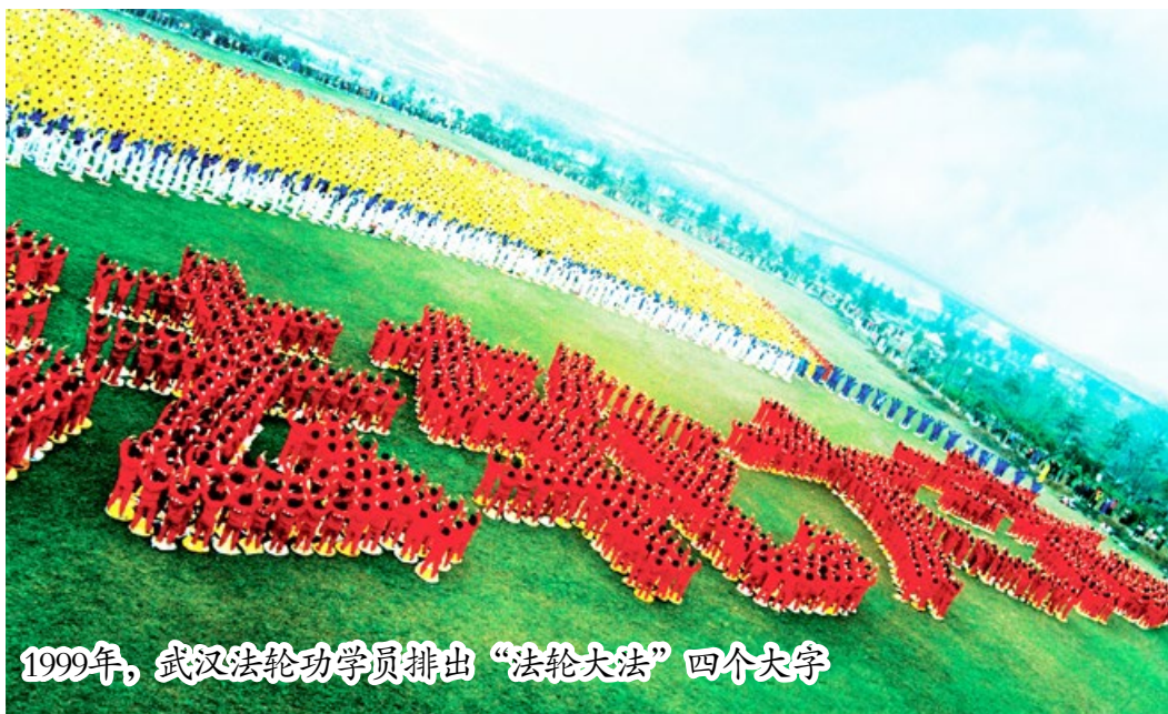
1999年，武汉法轮功学员排出“法轮大法”四个大字