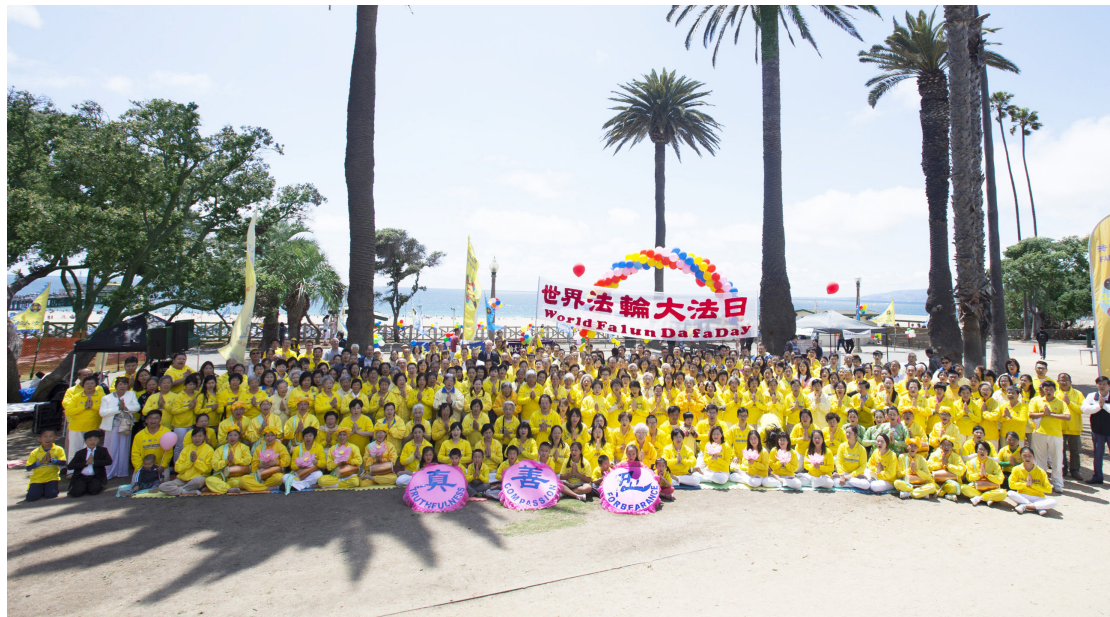
2016年5月8日，美国洛杉矶学员在圣莫妮卡码头公园欢庆世界法轮大法日，祝李洪志师父节日快乐。