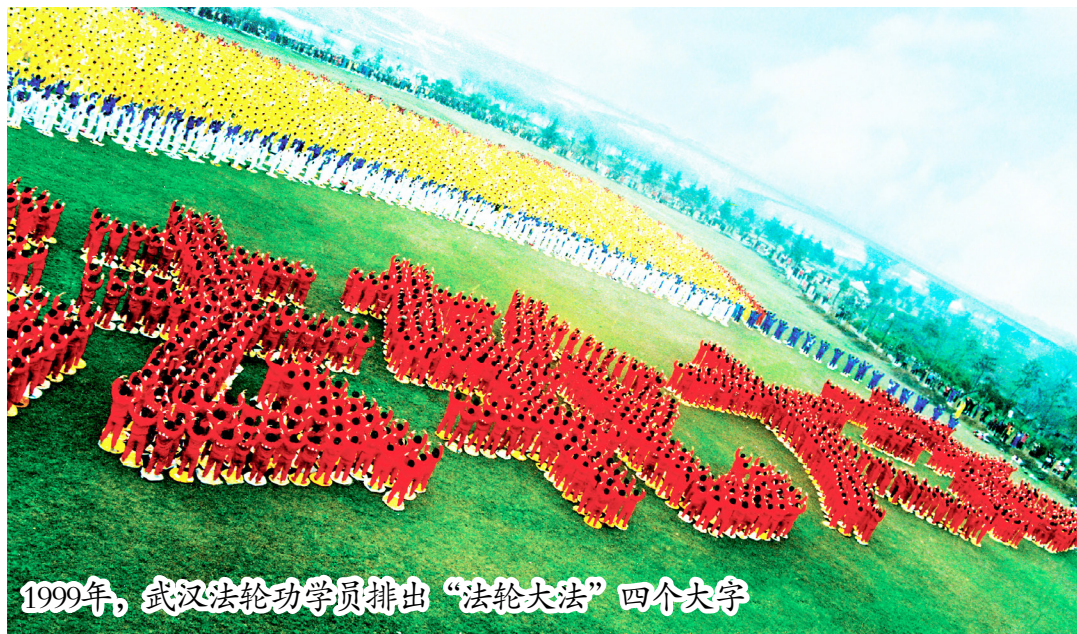
1999年，武汉法轮功学员排出“法轮大法”四个大字