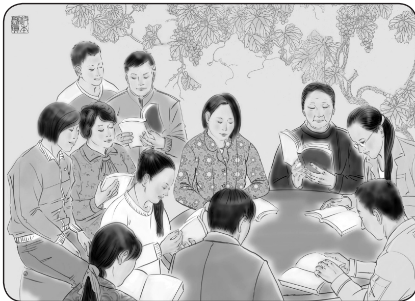
文：华东法轮功学员

我的大家族有 43 人先后走入了法轮大法修炼。十七年来，众多修炼的家人，在法轮大法师父的呵护下，幸福美满。