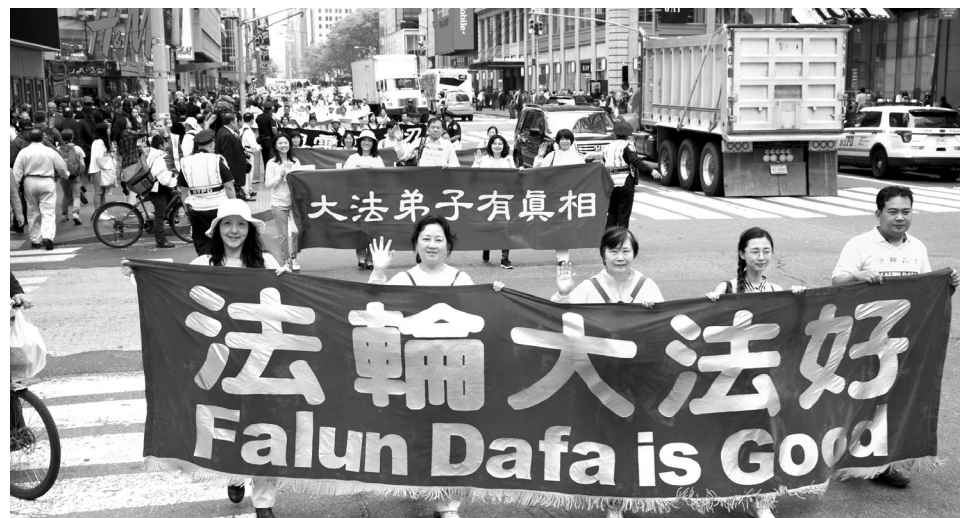
2016年5月13日，近万名法轮功学员在美国纽约庆贺5·13世界法轮大法日

此人讨了个没趣，搭讪着勉强挤在一个角落里，坐在他的本家晚辈身边，侧面对主席台。晚辈数落他：“你瞎活了这么大大岁数，尽说胡话！”◇