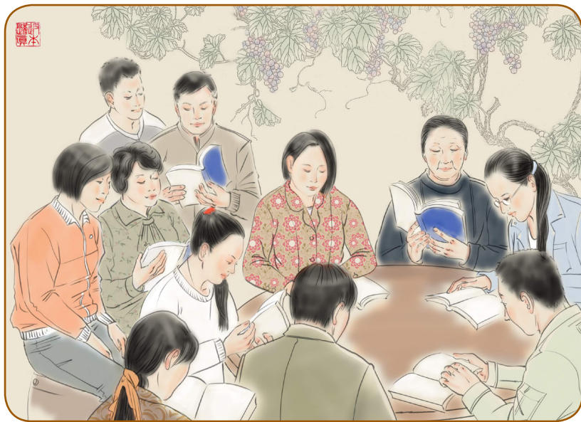
文：华东法轮功学员

我的大家族有 43 人先后走入了法轮大法修炼。十七年来，众多修炼的家人，在法轮大法师父的呵护下，幸福美满。