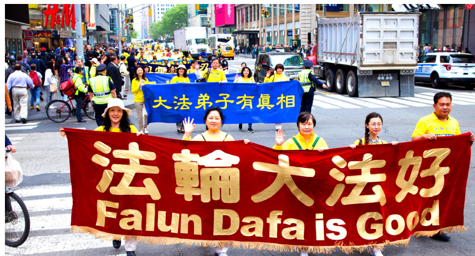
2016年5月13日，近万名法轮功学员在美国纽约庆贺5·13世界法轮大法日

此人讨了个没趣，搭讪着勉强挤在一个角落里，坐在他的本家晚辈身边，侧面对主席台。晚辈数落他：“你瞎活了这么大大岁数，尽说胡话！”◇