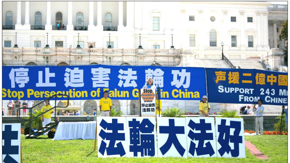
2016 年华盛顿 DC 法轮功反迫害大集会。罗斯·雷婷恩议员在现场发言。

作为国会众议院 343 号决议案的发起人罗斯·雷婷恩议员表示，这一决议案在国会通过是巨大的胜利，表明美国国会众议院用一致的声音宣布，他们知道中共政权的对法轮功学员犯下的种种恶行，包括酷刑、屠杀和血腥的器官活摘。她说，“美国国会众议院这个神圣的机构，这一代表自由、正义、尊重人权的机构，通过决议确认，这些令人发指的罪恶正在发生。今天，我很自豪地和你们站在一起纪念这一胜利。”