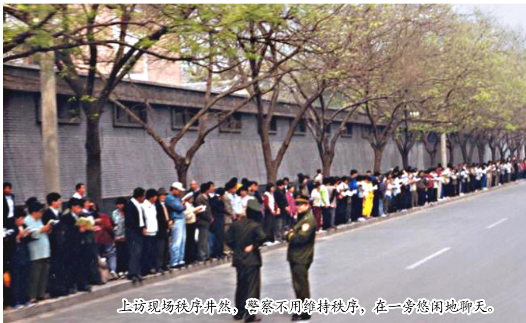
上访现场秩序井然，警察不用维持秩序，在一旁悠闲地聊天。