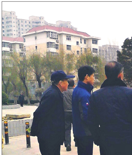
中国大陆多地出现要求法办江泽民的展板（2016 年 1 月摄于河北石家庄）

迫害开始后的 2000 年 4 月 9 日，公安部颁布《关于认定和取缔邪教组织若干问题的通知》（公通字[2000]39 号），该文件共认定邪教组织 14 种，没有法轮功。◇