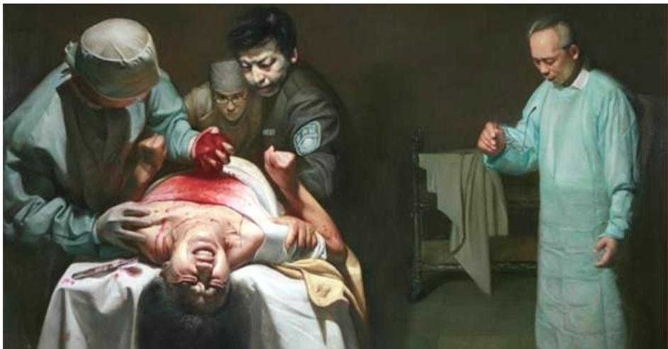
油画《活摘器官的罪恶》描述了中共活体强摘法轮功学员器官的惊天罪行