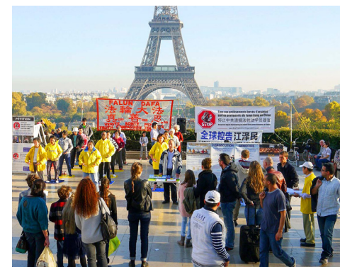
法国艾菲尔铁塔下，游客们了解法轮功真相。近年来，中国大陆游客在海外景点声明“三退”成风尚。

有人以为到了一定年龄就自动退队、退团了，其实不是。加入黑帮的人，一旦宣誓把一生献给这个组织，哪怕他几十年没参加黑帮活动，也是黑帮成员，除非公开宣布退出。“自动退”是中共规定的，这种“退”还是在顺从邪党；“主动退”是顺天意，会得到天佑平安。◇