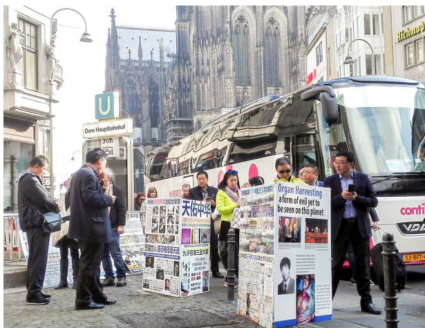
德国科隆大教堂前的广场上，大陆游客在阅读法轮功真相展板。中国大陆游客在海外旅游景点声明退党、退团、退队成风尚。

在当今西方社会里，“共产党”是带有高度贬义成分的名词。来自西方的共产主义和共产党，作为一种邪说和邪恶组织祸乱人间一百多年，遭全球唾弃（目前全球只剩四个共产党国家：古巴、越南、朝鲜、中国）。