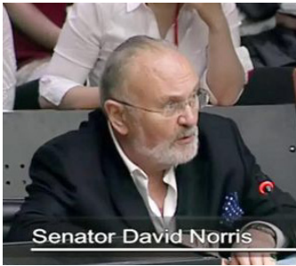
爱尔兰议会听证会

◆ 2013 年 7 月 10 日，爱尔兰议会外交事务及贸易联合委员会举行了关于阻止中共活摘器官的听证会，加拿大人权律师大卫·麦塔斯和美国作家伊森·葛特曼（Ethan Gutmann）运用大量调查数据和事实资料得出结论，2000 年至 2005 年间，至少有六万五千多名法轮功学员被中共活摘器官，而实际上被虐杀的法轮功学员可能超过上百万，与会议员对这一事实表示极大震惊。