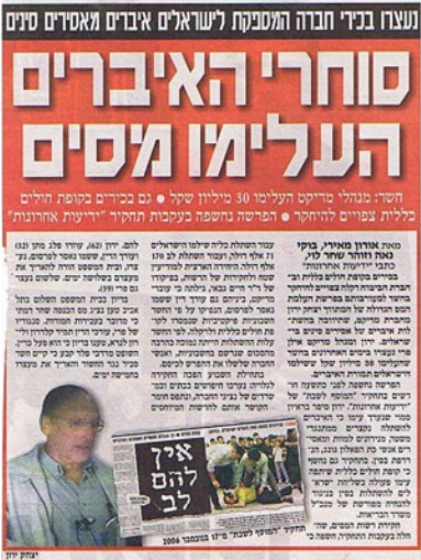
▲ 以色列最大的报纸《Yediot Achronot》的报道。

从劳教所和监狱里出来的不少法轮功学员都提到了他们在里面被抽血的经历。2008年7月，《血腥的活摘器官》的作者之一大卫·麦塔斯在美国找到一个曾被关押在江苏省某监狱的人。他不是法轮功学员，从2005年3月至2007年初，2年多的关押期间里，曾被换了17个监号。在里面关押的时间长的犯人告诉他，在2002年到2003年期间，每个号里面都至少发生过2~3起活摘法轮功学员器官的事情。新唐人电视台2009年7月制作的电视片《生死之间》里面有对该证人的电话采访。