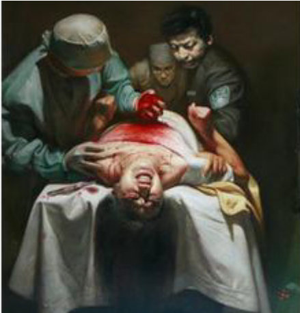
▲ 撷取自油画作品《活摘器官》 全国的一部份，作者董锡强

【注：在最初交谈中，证人为了不暴露自己，没有明确说出活摘器官的场所。在第二次交谈中，证人明确说出活摘器官是在沈阳军区总医院15楼的一间手术室内进行。经核实，沈阳军区总医院15至17楼均为外科。】