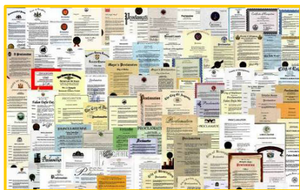
▲法轮功获各国政府褒奖、支持议案和信函3000多项。上图是来自世界各国的部分褒奖。