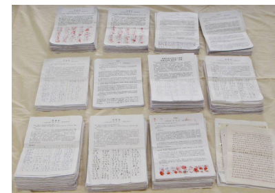
图：河北唐山四万五千一百九十三人签名举报江泽民。

“全球声援中国民众控告江泽民的刑事举报联署活动”从 2015 年 7 月到 2016 年 9 月，港澳、台湾、日本、韩国、印尼、新加坡、马来西亚等亚洲 7 个国家及地区已有 180 万人连署举报江泽民；自 2015 年 5 月至 2016 年 5 月，在中国大陆已有超过 21 万名民众联名举报迫害法轮功的元凶江泽民。