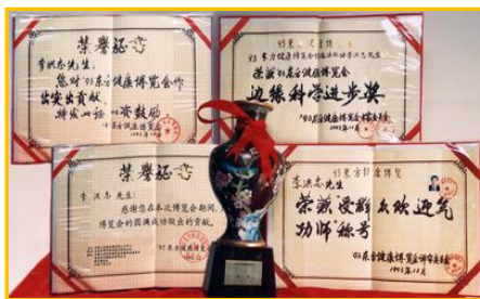
▲1993年北京东方健康博览会上,李洪志先生荣获博览会最高奖项“边缘科学进步奖”。

“真善忍”的信仰得到了世界各族裔民众的爱戴和尊敬,却在中國大陸一地受到残酷迫害。◇