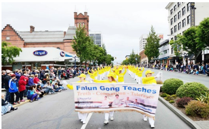
2016年5月30日，在德国西部城市多特蒙德第九届国际文化周开幕式上，法轮功学员在演示功法。