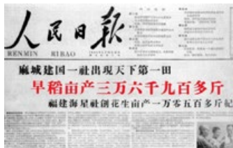
官媒明目张胆地造假