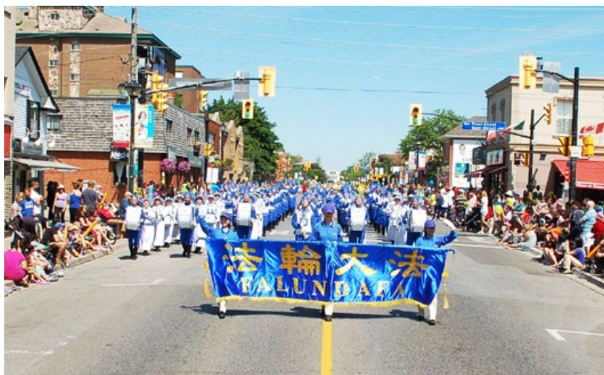
2016年6月4日上午，加拿大多伦多法轮功学员参加密市丰收节游行，一路上观众给予热烈的欢迎和赞赏。