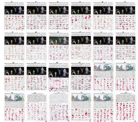
▲辽宁凌源民众联名举报江泽民