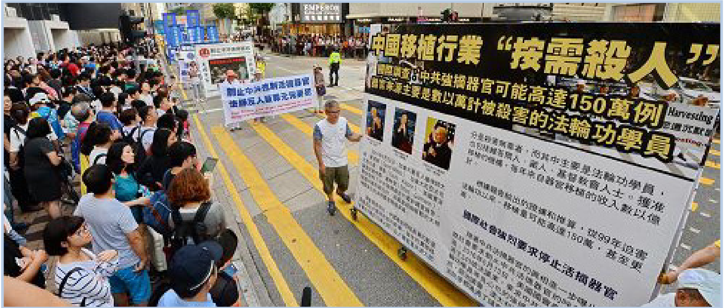
图：8月21日接近中午时分，香港法轮功学员在政府总部外举行“制止中共强摘器官”集会之后，游行队伍从九龙深水埗枫树街游乐场出发，历经二个半小时，到终点站尖沙咀天星码头，揭露中共强摘器官罪行。