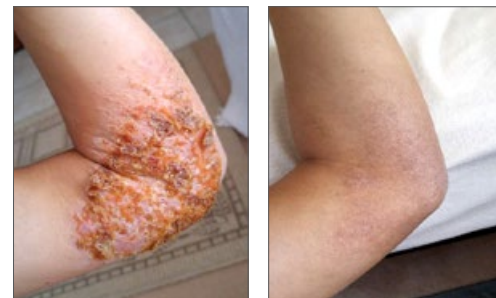
左图：炼法轮功前（摄于2015年12月12日）

现在，我已开始阅读《转法轮》（法轮功的主要著作），以加深我对“真、善、忍”的理解。如果有更多的人知道法轮功，修炼法轮功，我相信这个社会的道德会整体提升。◇（文／彬海）