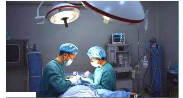
中共迫害法轮功后，大批法轮功学员被非法关押，在同一时间段，国际上掀起了到中国器官移植旅游的热潮。图为《费加罗报》文章配图。

“法轮功是一种佛家修炼方法，让人身体健康及道德升华。这一功法在二十世纪末吸引了近1/12的中国人来学，深受民众喜爱。这却让时任中共总书记的江泽民不悦，他下令从1999年（7月）开始抓捕法轮功学员。根据国际大赦组织的报告，从那以后，法轮功学员们被关满了中国的监狱。1999年～2004年间，中国大陆的移植手术数量增长了4倍，这与（中共对法轮功的）迫害时间段相吻合。”◇