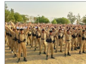
印度警察大学学生炼法轮功

法轮功学员于2009年4月13日下午受邀到印度首都德里警察训练大学介绍法轮功，该大学分男、女两个学院，三千多名学生现场学炼法轮功，场面壮观而祥和。