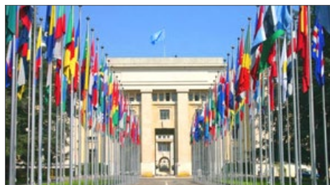
联合国万国宫（瑞士日内瓦）

◆美国国会众议院于2016年6月13日通过343号决议案，要求中共停止强摘法轮功学员和其他良心犯的器官。美国国会外交委员会于2014年7月通过281号决议案，谴责中共强摘法轮功学员等良心犯器官。