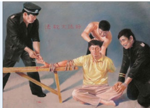
酷刑图示：用竹签扎手指

口的牙齿都被打掉，十个手指的指甲被牙签穿透，曾7天7夜不被允许睡觉，被戴上28公斤重的手铐和脚镣关进小号受罚，他的锁骨曾被打碎。