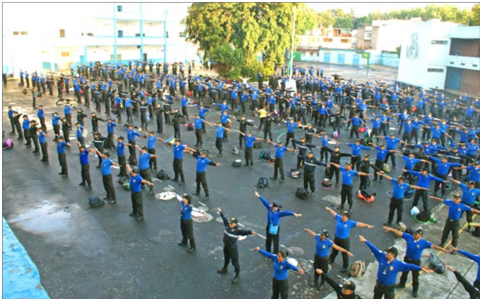
2016年7月18日至22日，墨西哥六百多名警察学习了法轮功功法。