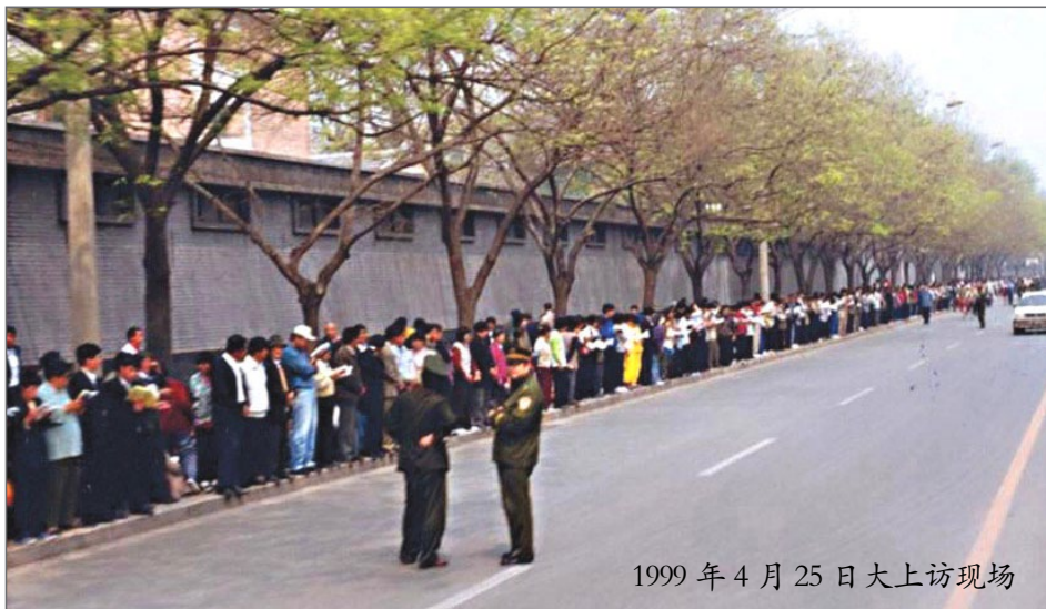
1999年4月25日大上访现场