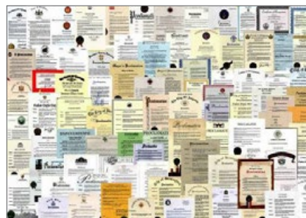
国际社会褒奖法轮大法