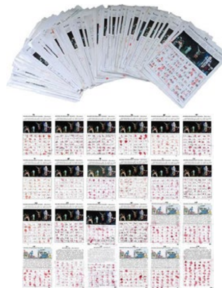
辽宁凌源民众联名举报江泽民

我们就是要让你们吃药、喝酒、抽烟。”当时有 30 多名法轮功学员被抓进洗脑班折磨。对女性法轮功学员，警察除了毒打外，还进行人身侮辱，扒衣服、摸乳房等。一名年轻女孩被警察的暴行吓得精神失常。如今，宋久武猝死，被他迫害过的法轮功学员没有恨，而是惋惜，因为宋久武也是被中共江泽民集团谎言蒙蔽的受害者，如果他能早些明白法轮功的真相，不参与迫害，也许不会有此下场。◇