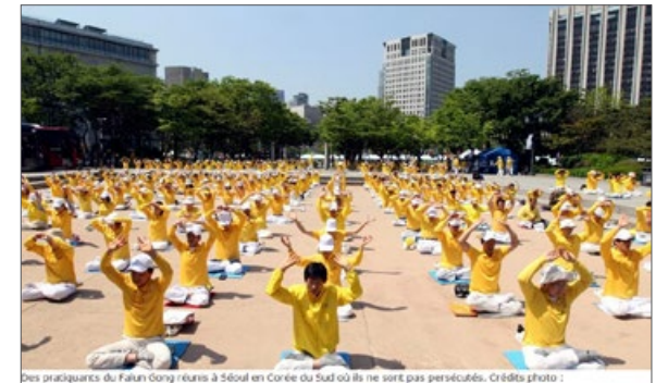
中共是全球唯一迫害法轮功的政权。图为《费加罗报》配图：韩国法轮功学员。那里没有迫害。