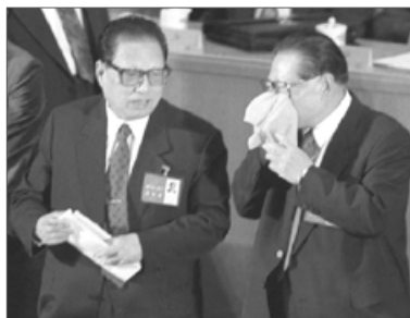
乔石一直强烈反对江泽民迫害法轮功。图为“十五大”上的乔石与江泽民

在2003年3月全国第九届政协第五次大会上，政协主席李瑞环没有代表全国政协做工作报告，而是由副主席李贵鲜代替，引起国内外的各种猜测，真实的原因是江泽民在全国政协工作报告中强行加入同法轮功做斗争的语句，李瑞环以拒绝在大会上发言对江泽民予以抵制。