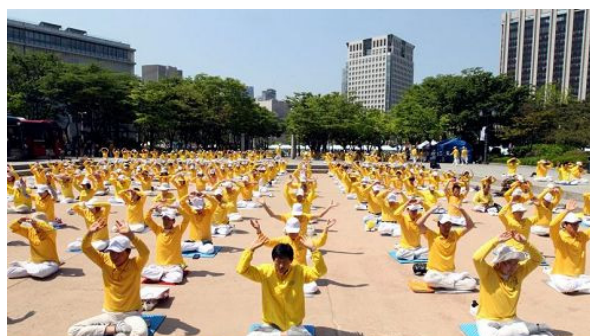
Des pratiquants du Falun Gong réunis à Séoul en Corée du Sud où ils ne sont pas persécutés. Crédits photo :

◀中共是全球唯一迫害法轮功的政权。图为《费加罗报》文章配图：韩国首尔的法轮功学员。那里没有迫害。