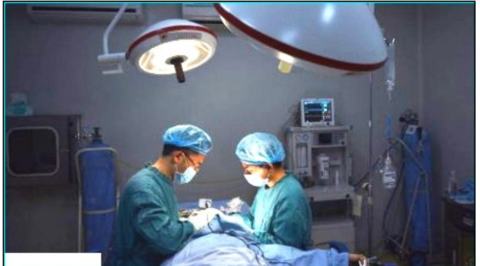
▲中共迫害法轮功后，大批法轮功学员被非法关押，在同一时间段，国际上掀起了到中国器官移植旅游的热潮。图为《费加罗报》文章配图。

这份来自加拿大的报告充满了令人震惊的证词。比如一位台湾公民，曾经仅仅在数周内接收过来自中国大陆的至少 7 个供体器官。这样的事情在西方不太可能，因为等待器官要历时数月甚至几年。来自蒙彼利埃大学医院的外科医生 Francis Navarro 说：“这真的造成了（国际患者到中国）器官移植旅游热潮。用 7 万美金可以订购包括往返机票、旅店和一个肾脏的全套服务。”他曾经多次参加过相关话题的会议。