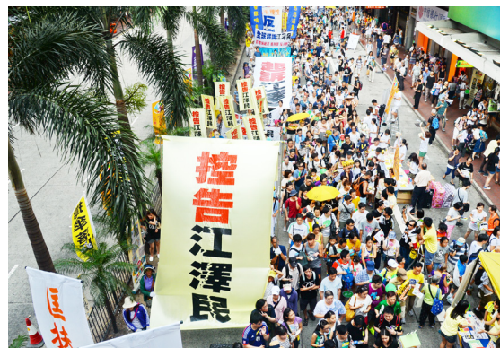
法轮功学员在香港游行，声援全球“诉江”大潮

迫害法轮功的罪魁祸首江泽民，在 1999 年时，曾叫嚣“三个月消灭法轮功”，下令对法轮功学员实行“名誉上搞臭”、“经济上截断”、“肉体上消灭”的灭绝政策。然而法轮功并没有被消灭，反而弘传世界 100 多个国家和地区。