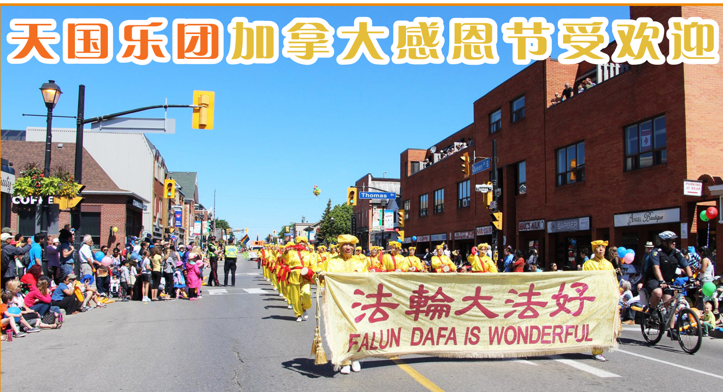
▲ 由法轮功学员组成的腰鼓队在密西沙加市参加感恩节游行。 ▼ 天国乐团在基奇纳—滑铁卢双子城参加感恩节游行。