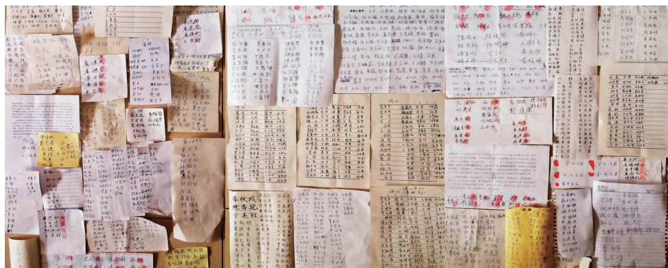
潍坊市部分市民签名举报迫害元凶江泽民

在明慧网 2016 年 6 月 4 日报道山东潍坊市两个乡镇七千人签名举报江泽民之后，从 2016 年 8 月初到现在，据不完全统计，其中一个辖区仅三个月，又有 4567 人签名举报迫害法轮功元凶江泽民。