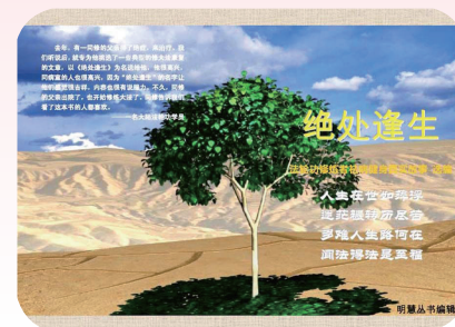
明慧丛书：《绝处逢生》

本书收集的这些故事均采编于明慧网 www.minghui.org ，本书也是“明慧丛书”系列的一集。这些故事仅仅是沧海一粟，因为在当前中国大陆的迫害尚未结束的情况下，很多修炼者暂时还无法将他们自己的经历写出来发表供更多的人借鉴。