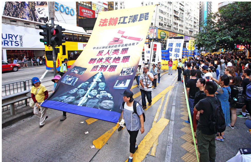
自2015年5月以来，已经有超过20万法轮功学员及亲属控告江泽民。一年多来，在亚洲七个国家及地区已经有超过180万人联署举报江泽民。图为2016年10月1日香港大游行。

征签过程中，人们不仅愿意举报江泽民，而且还有越来越多的民众声明“三退”（退党、退团、退队），“举报江泽民”“三退保平安”甚至成了流行语。