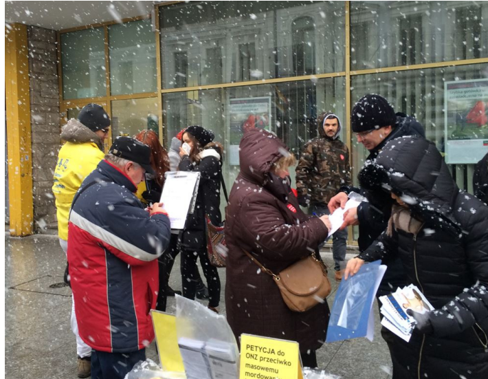
图:漫天大雪也挡不住人们反迫害征签