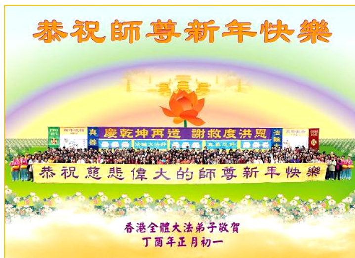
图: 香港全体大法弟子敬献给师尊的新年贺卡

恭祝活动在上午九时许拉开序幕。腰鼓队向师尊敬献表演后, 学员们端正站立, 恭祝合十, 齐声高呼: “师父您好! 师父过年好!” “恭祝师父新年快乐!” “谢谢师尊救度洪恩!” “助师正法, 救度众生!” 进入合唱环节, 众学员齐声高唱《谢师恩》、《法轮圣王》、《来归行》、《法正乾坤》等大法弟子歌曲。当唱到“师恩浩荡师恩重, 寸草难报三春晖”等感恩歌词时,