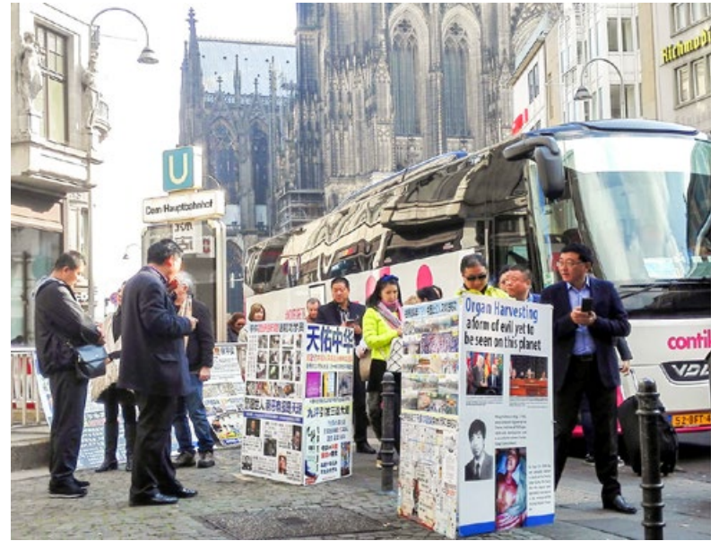
德国科隆大教堂前的广场上，中国大陆游客看法轮功真相展板。

上天是慈悲的。加入中共党、团、队的绝大多数人，也是被欺骗的对象，或稀里糊涂地加入，或为生计、为有一个好的社会地位……在中共的党、团、队员中，有很多善良、正直的人，因