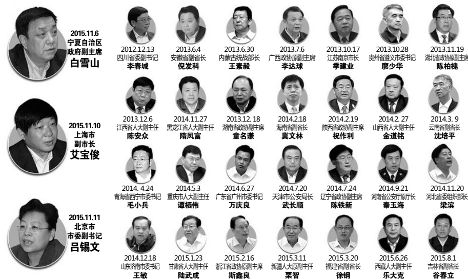
图：追随江泽民迫害法轮功的中共官员近年来纷纷落马