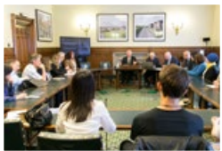
时间：2016.7.4 地点：英国国会 议题：中共强摘良心犯器官研讨会