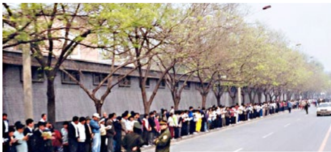
图：上访现场秩序井然，警察不用维持秩序，马路上机动车、自行车正常行驶。