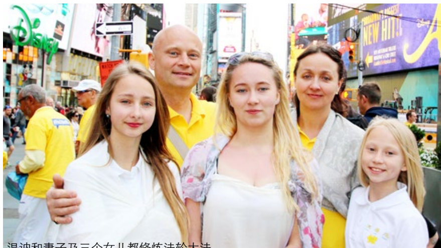
温讷和妻子及三个女儿都修炼法轮大法