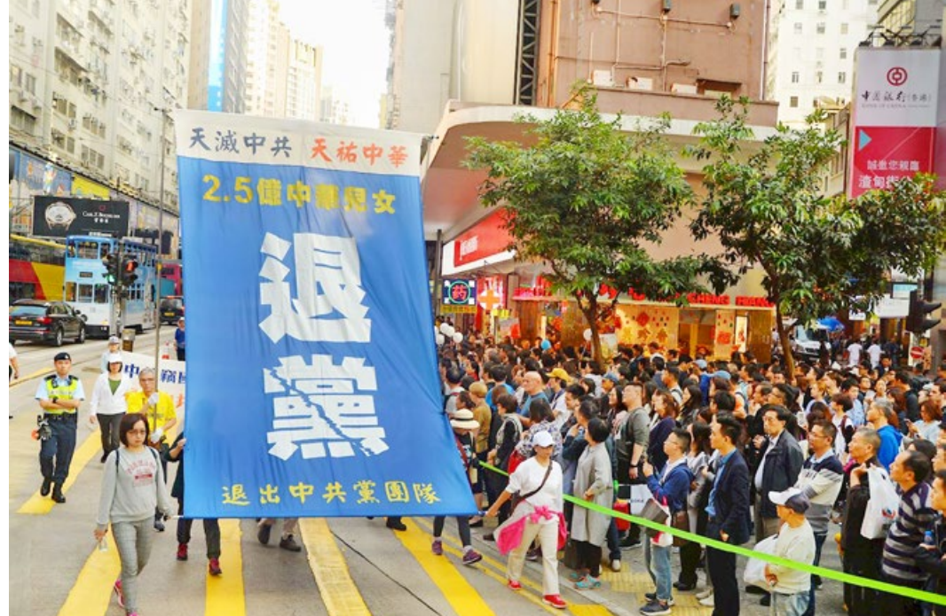
2016年12月10日国际人权日，香港法轮功学员大游行，声援2.5亿中国人“三退”（在海外网站发表声明，退出中共党、团、队组织）。

另外共产党走的是高税收、低收入的路。假如你一年创造10万元产值，它给你的工资只是很少一部分，你工作时创造的产值足够养活你一辈子。工资、退休金是你工作时赚来的，不是党给的。◇