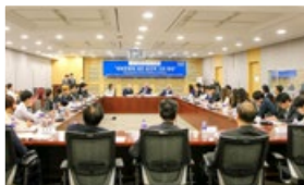
时间：2016.10.13 地点：韩国国会 议题：聚焦中共活摘器官暴行论坛