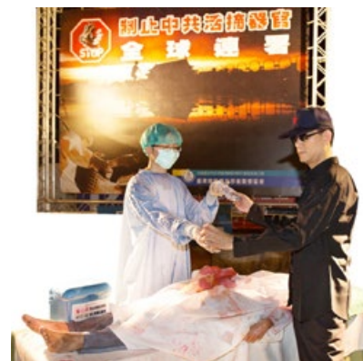
中共活体摘取法轮功学员器官演示

联合国特派专员弗瑞德·诺瓦克先生指出，2000～2005 年是法轮功学员被中共迫害最残酷时期，也是中国器官移植手术暴增阶段。