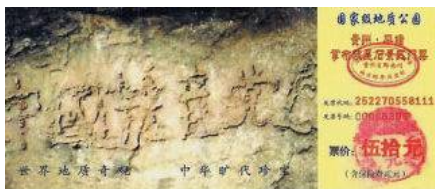
图：贵州平塘县掌布谷国家地质风景公园门票

不管中共怎样掩盖，明白人知道，天意就在眼前。中共几十年来靠谎言与暴力维持政权，通过政治运动败坏人心，摧毁传统