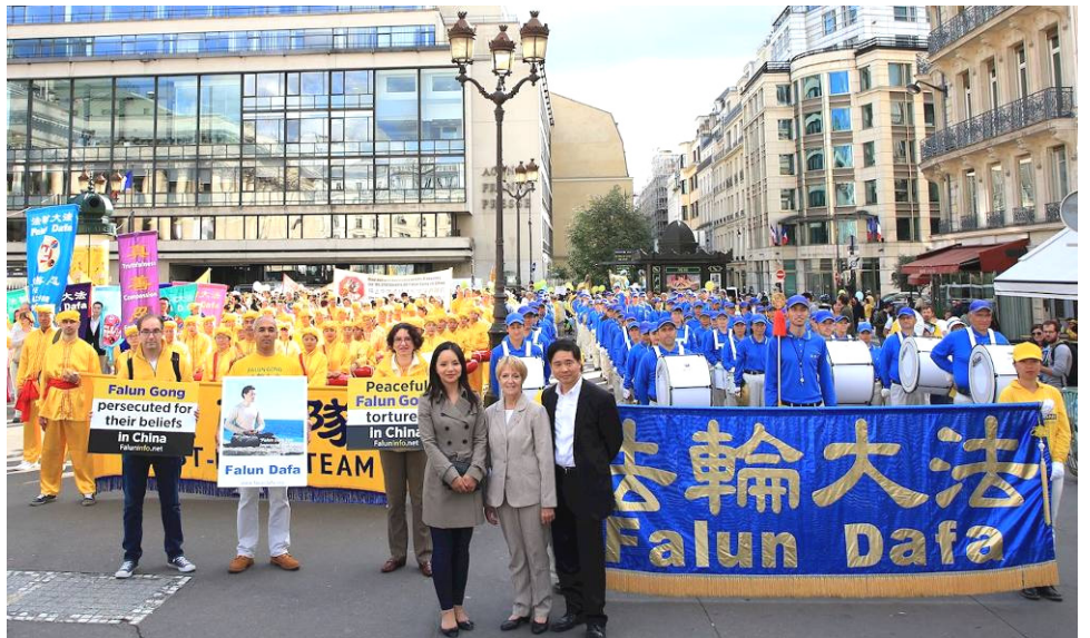
游行出发前法国前部长奥斯塔丽女士与法轮功学员游行队伍合影。

奥斯塔丽女士在演说中还提到，中国是《世界人权宣言》的签署国之一。她说：“《世界人权宣言》第十八条：人人有思想、良知与宗教自由的权利；第三条：人人有权享有生命、自由和人身安全；第五条：任何人不得加以酷刑，或施以残忍、不人道或