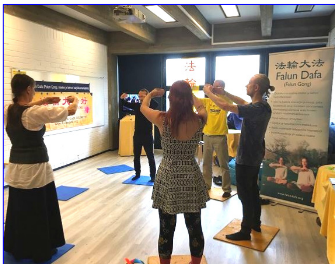
■游客在芬兰“精神与认识”展会上学炼法轮功

对于很多参加过“精神与认识”展会的芬兰人来说，法轮功（法轮大法）早就是耳熟能详的功法。在过去几年中，有不少参加这一展会的人当场学习法轮功五套功法，也有些人在法轮功展位前驻足观察，并且希望了解炼功点地址从而方便以后学法轮功。在2017年10月14至15日的两天展会期间，前来学法轮功的人络绎不绝，法轮功学员轮流教授，没有停歇过。