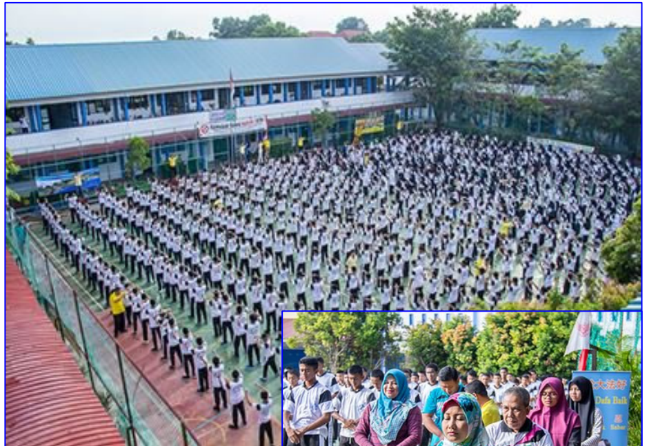
■七百多名印尼国立巴淡岛高中学生及教师集体学炼法轮功

大约一个小时的时间，法轮功学员示范了第一至第四套功法，教学生及教师们功法动作，并介绍功法特点。学完功之后，有一部分学生分享了尝试功法的心得，有人表示法轮功动作容易被理解、温和，但炼了却能流汗，另外还能锻炼自己的忍耐力，身体感觉很放松，音乐也能帮助集中自己的注意力，身心都变得更平静。◇