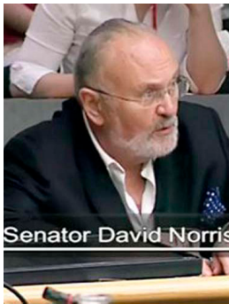
爱尔兰议会听证会

◆ 2013 年 12 月 12 日，在本年度欧洲议会最后一次全体大会上，议员们投票通过了一项紧急议案，要求“中共立即停止活体摘取良心犯、以及宗教信仰和少数族裔团体器官的行为”。这项决议要求“欧盟对中国境内的器官移植，以及与这种不道德行为相关的迫害做出全面、透明的调查。”决议同时呼吁中共“立即释放”包括法轮功学员在内的所有良心犯。