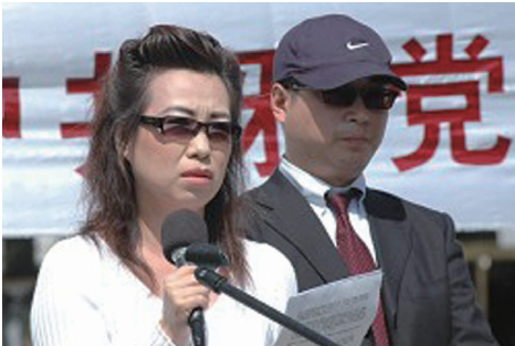
图：2006年4月20日在白宫附近证人安妮与皮特现身揭露中共活体摘取法轮功学员器官的滔天罪行。

在接下来的几个星期中，“追查迫害法轮功国际组织”（简称“追查国际”）的调查员和一些媒体记者以患者的身份给国内一些相关医