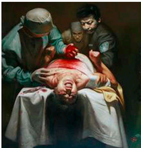
图: 撷取自油画作品《活摘器官》全图的一部份,作者董锡强。

●武汉市湖北省医科大学第二附属医院, 电话 67813104 分机 2960/2961, 2006 年 4 月 2 日。