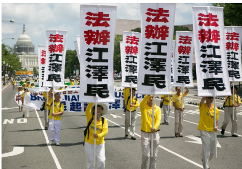
图：2016年7月14日法轮功学员在美国首都举行大游行。