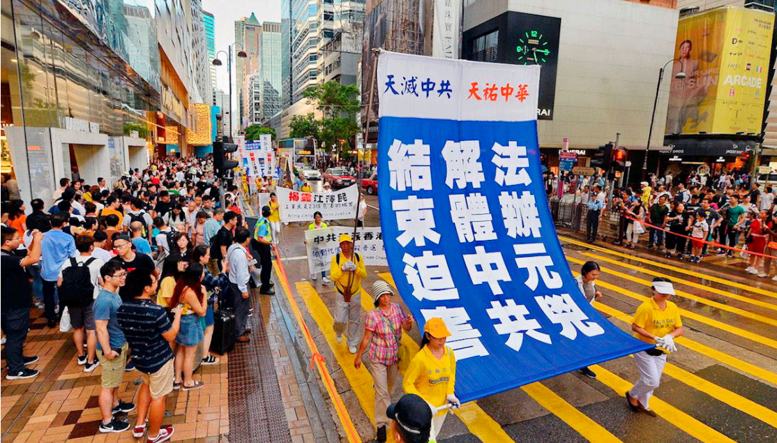
图：2017 年 10 月 1 日，香港法轮功学员举行反迫害大游行。