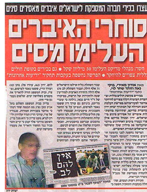
图: 以色列最大的报纸《Yediot Achronot》的报道。