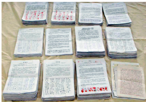
图：河北唐山45193人签名举报江泽民。